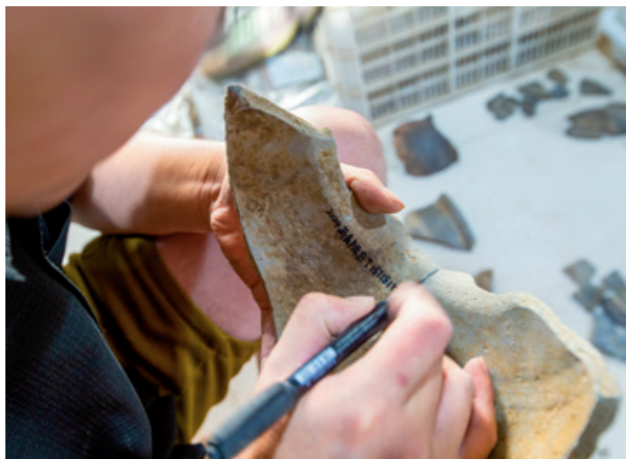
为发掘的文物碎片编号

址所在地。五年的时间里，他们先后对学宫东、南门址，边界、形制、规模、内部结构等有了较为清晰和明确的认识，找到了切实的证据。