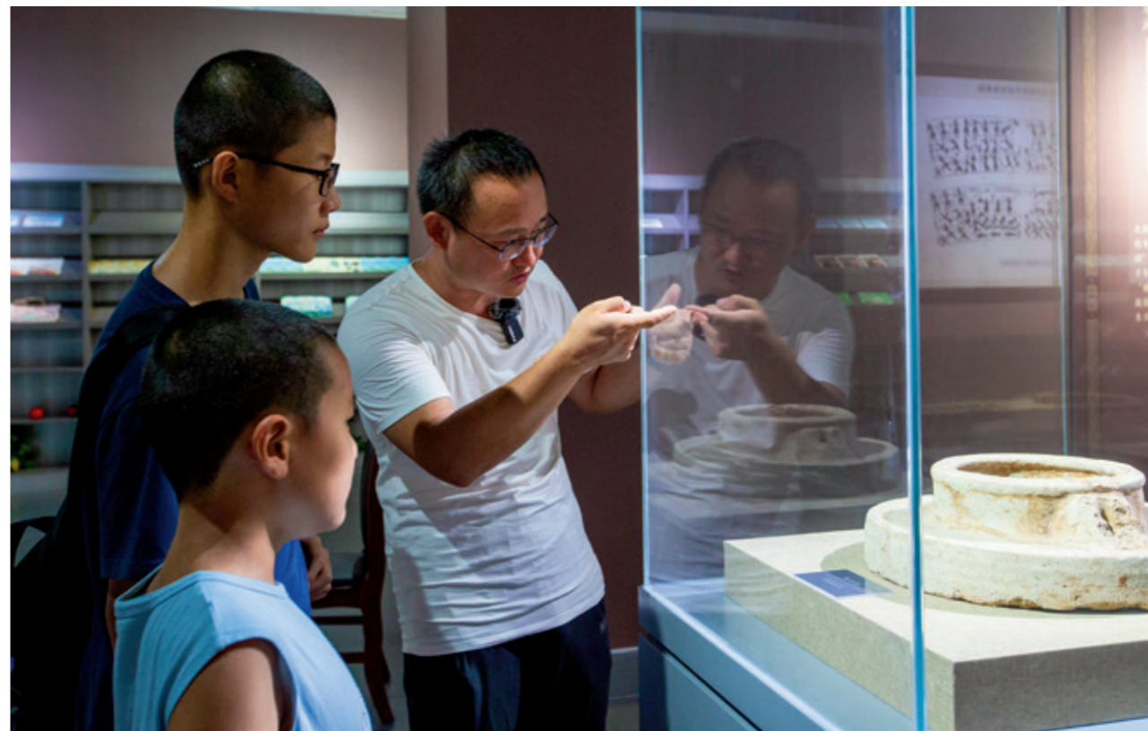
在高青县博物馆为青少年讲解文物历史