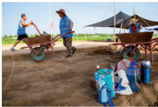
夏日炎热，考古工人们带的水杯被集中放在阴凉处

南墓地等 7 处重要遗址的系统资料整理。其发表的《临淄齐国故城出土钱范研究》是第一部基于科学考古发掘出土齐国钱范整理研究的专著，《临淄棕桐城墓地：山东战国—汉代墓葬的发掘与研究》则填补了该地区战国至汉代考古研究的空白。