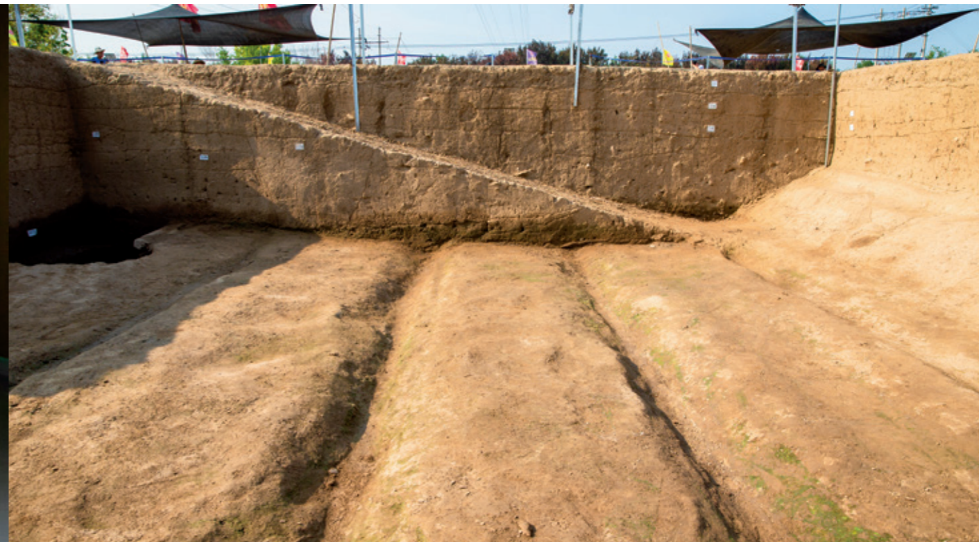
稷下学宫遗址东门堞发现的车辙