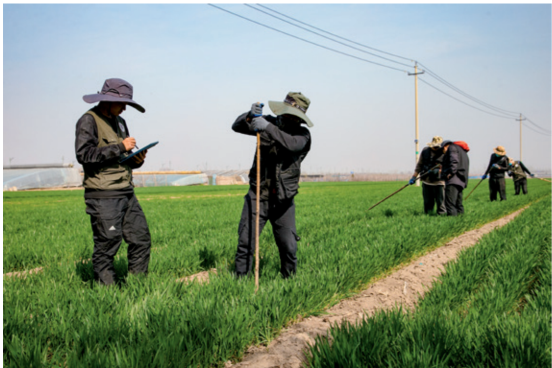
考古工作队进行田野考察

南墓地等 7 处重要遗址的系统资料整理。其发表的《临淄齐国故城出土钱范研究》是第一部基于科学考古发掘出土齐国钱范整理研究的专著，《临淄棕桐城墓地：山东战国—汉代墓葬的发掘与研究》则填补了该地区战国至汉代考古研究的空白。