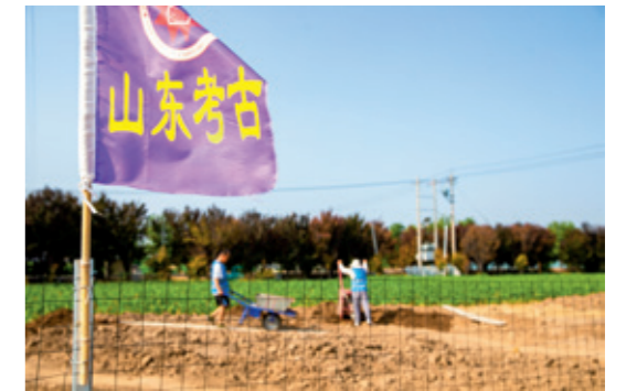
董文斌主持挖掘的稷下学宫遗址项目备受公众关注

2019年，在山东省文物考古研究院的支持下，董文斌带领团队开始了艰难的探寻之旅。他们“在（临淄）小徐村西侧发现了一批高等级的战国建筑群”，在文献、方位、考古发现等多方面的证据支持下，基本确定这里就是稷下学宫遗址。