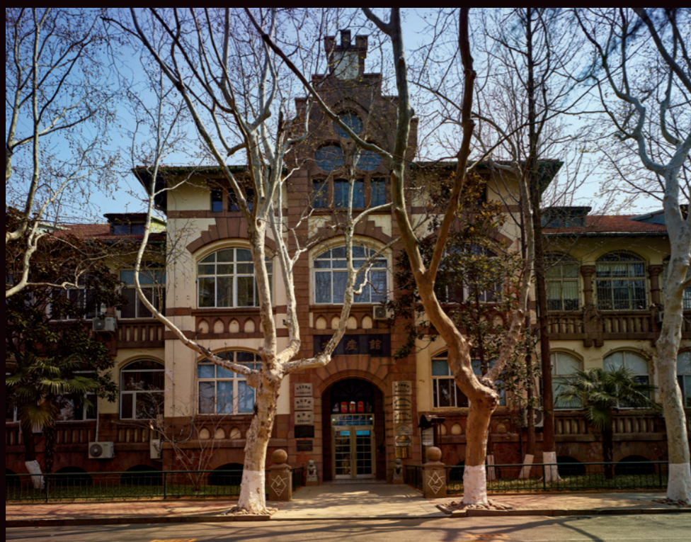
中国海洋大学鱼山校区校园内的俾斯麦兵营旧址