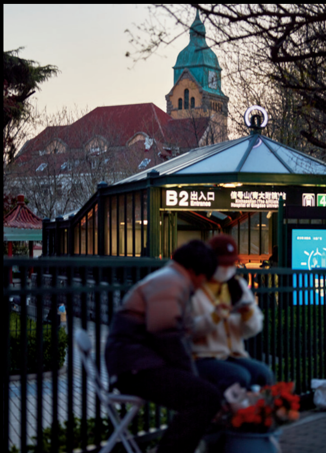
在时光里跋涉的时间越长，在这个世界上留下的痕迹越清晰