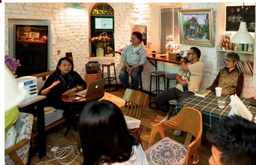
每周，小楼内都会有一群人聚集，分享自己的读书心得

「你不知道我为了给你带一份礼物， 花了多少心思。 似乎什么都不合适。 带金子到金矿， 往海洋里倒水， 有什么意义呢。」