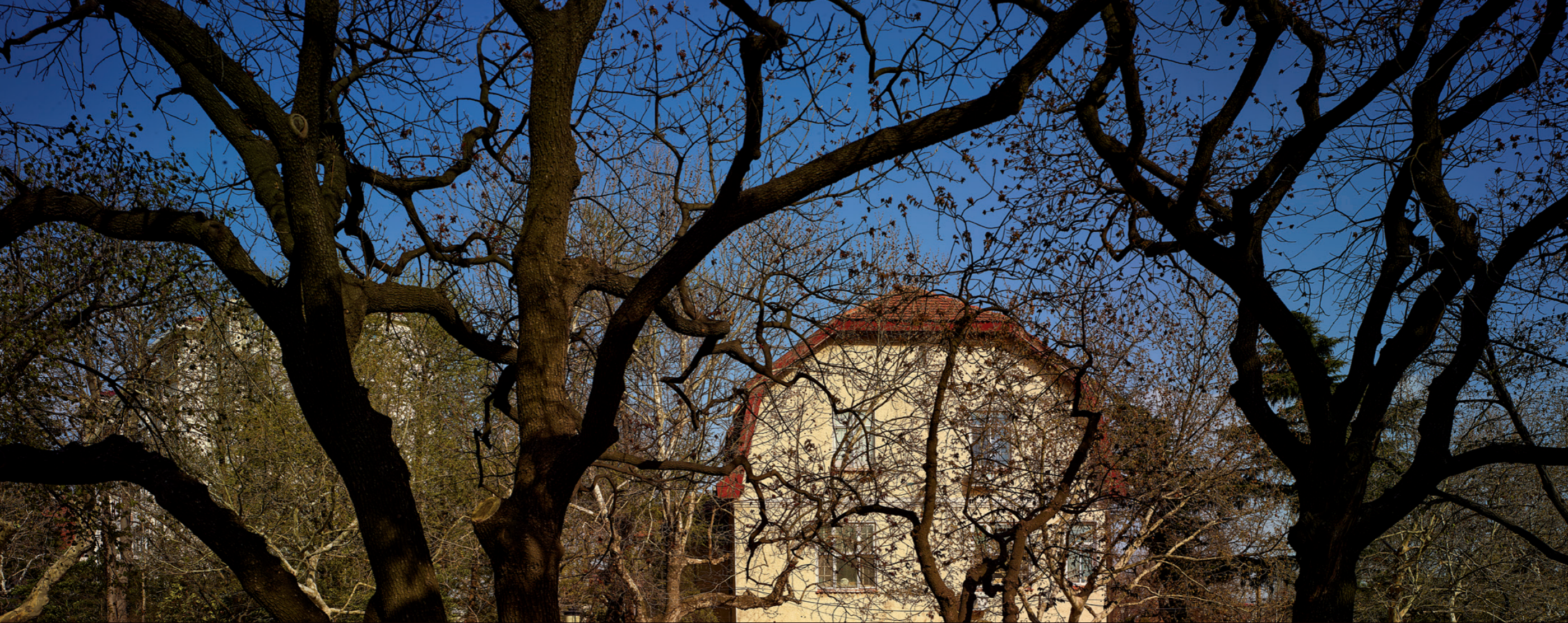
枝桠间可爱的房顶，如漫画中的世界

该会被改写。德国人的首选是舟山群岛，次选便是胶州湾。但英国人抢先一步获得在舟山群岛的部分权益，让胶州湾成为德国人的首要目标。