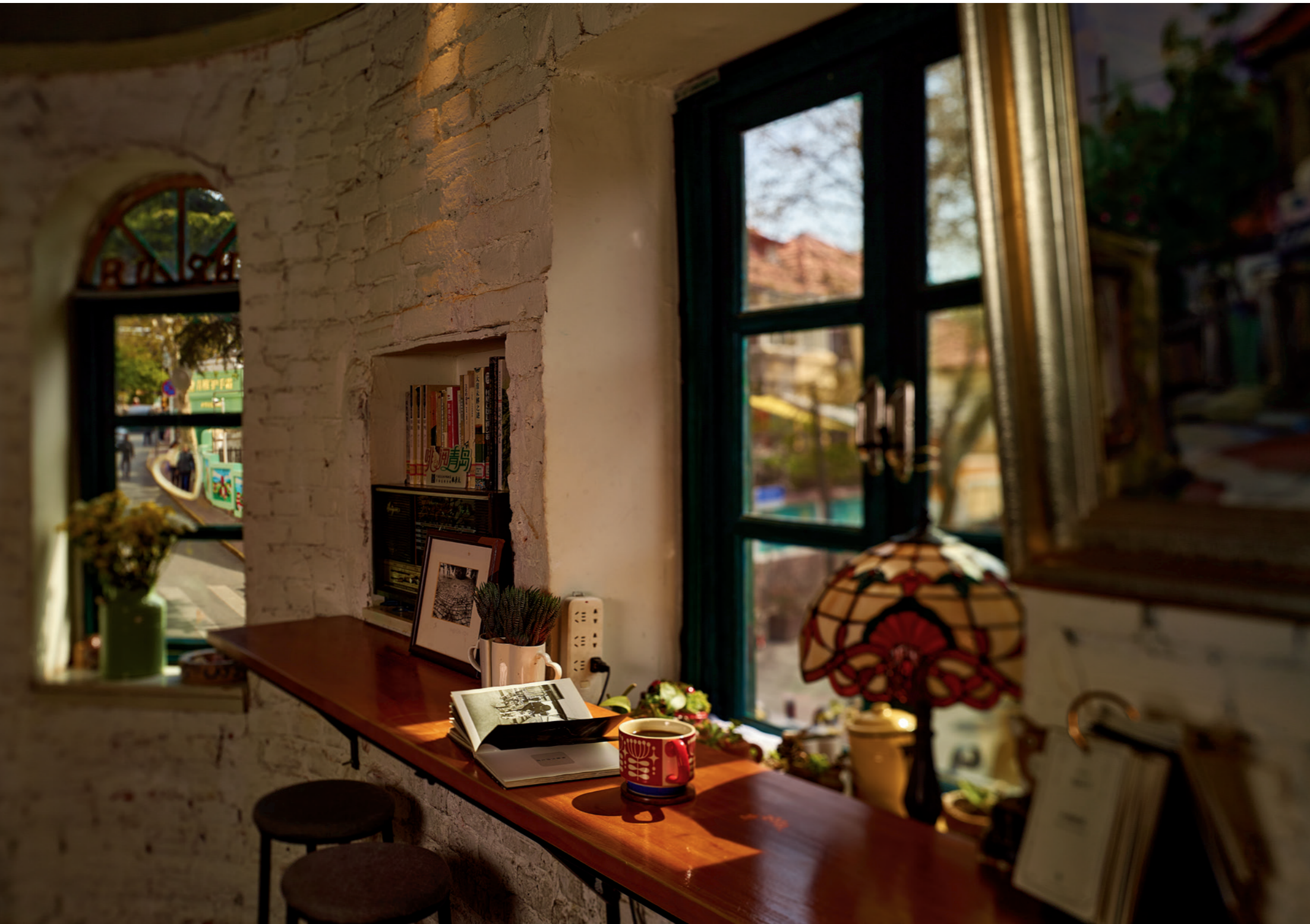
一本书，一杯咖啡，就能让心中有爱的人不舍昼夜