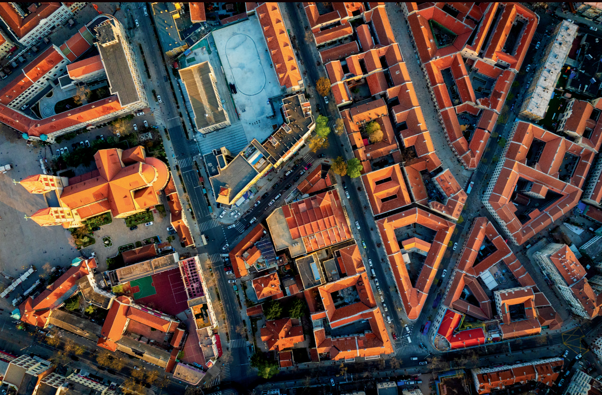
空中俯瞰，里院也就是华人区的建筑格局一目了然

地面裂缝处填土，在倾斜的地方垒石块，做成类似梯田的结构，防止水土流失。据说，德国人在青岛进行了600多次实验性栽培，在1910年一年内就栽种了15000多株梧桐树苗。