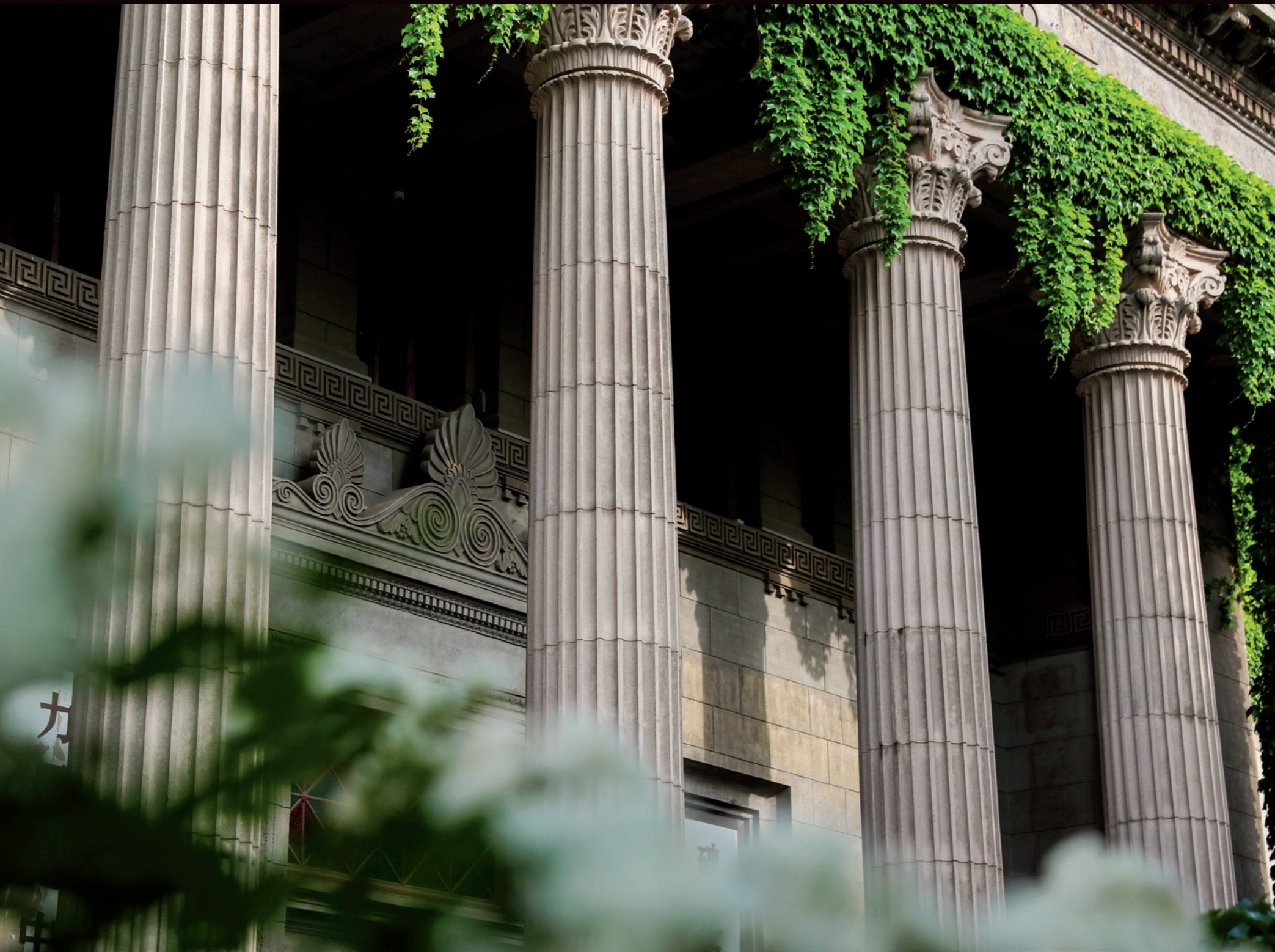
取引所是日本设计师在青岛的代表作， 但风格仍偏欧式