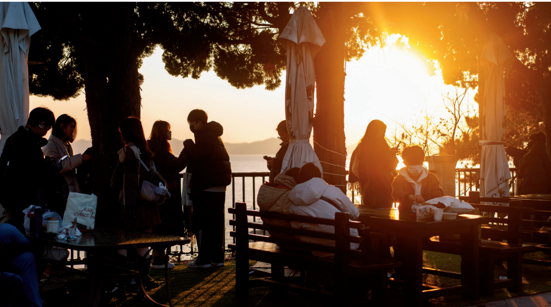
夕阳的暖色调跟青岛很搭

二零一七年，青岛市机关事务服务中心负责牵头打造「八大关·太平角万国文化建筑博览汇」（简称「万博汇」）项目。王开生深知人才的重要性，在最短的时间内组建起一支高学历、高素质、高效率的团队。张清元就是在这时加入了这个团队。在「一座别墅楼展示一国文化主题」的思路下，团队将太平角区域打造成为集文化传播、建筑欣赏、艺术品鉴、时尚休闲于一体的可体验公共文化景区。如今，太平角区域已被人广泛熟知，吸引了越来越多全国各地游客前来旅游观光。「万博汇」项目先后被评为「青岛文旅新十景」和青岛市第一批「时尚艺术街区」。而由王开生深情作词的《太平角之恋》成为「万博汇」项目的推广曲，也被山东省文化和旅游局评为「齐鲁鲁韵最当歌」原创歌曲十佳，荣获山音海乐·青岛最动听原创歌曲排行年度「十大金曲奖」。