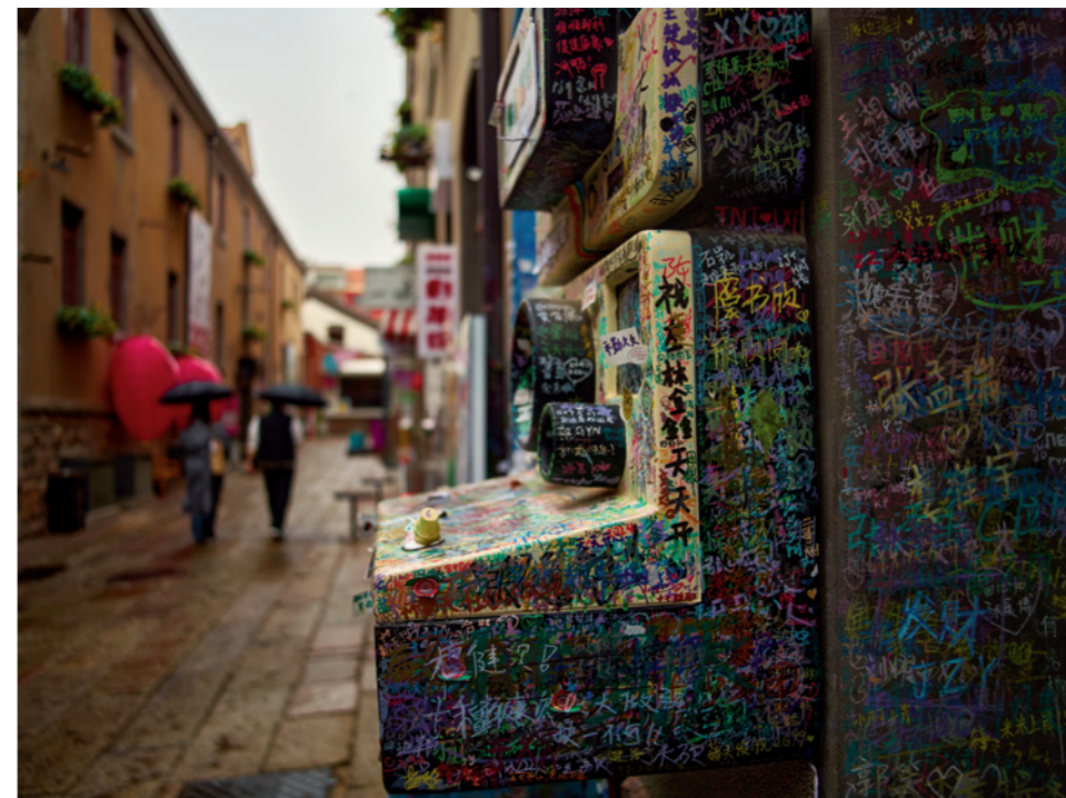
上街里的街角涂鸦，街景与愿望同样斑斓