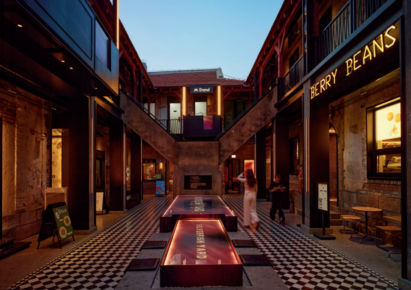
砖墙、水泥、金属……现代装饰材质与里院的传统红砖木栏构成年轻人喜欢的时尚感

于陇海线东部起点的连云港老街可以看作这座城市近代的商业起点，其活态的商业氛围自国民政府在此建港始，一直延续至今。所以在那里感知的不是「复古味」，而是真正的「古味」。在四方路，我体验到了与连云港老街相同的味道。 四方路街区，也就是我们常说的大鲍岛区域，是德国人最早规划的华人集中居住区。如今，这里有青岛现存数量最多、保留最完整、单体面积最大的里院群落。它们多建于二十世纪三十年代，作为东西方建筑理念融合的产物，这里是除了八大关之外了解百年前青岛另一面的窗口。沿街的古建筑、老宅院、复古招牌，都透出时间的沧桑与厚重。让人想象不到的是，就在几年前，这里还是一条曾因私搭乱建、设施老化而被遗忘的老街。在青岛城市东扩的进程中，作为老城商贸中心的大鲍岛片区一度陷入原住民流失、建筑失修、商业凋敝的窘境。不过这种趋势很快被扭转，建筑修旧如旧，留住老街的「根」；商业形态重构，激活里院的「魂」。仅用了五年的时间，这里就从衰落的商业中心变成年客流量超过一千七百万人次的青岛文旅新地标。 站在四方路的西头东望，视线的尽头是观象山，望火楼的旧址矗立在山顶。层层叠叠的老建筑依山势而建，错落有致，红瓦绿树在夕阳的映衬下如此具象。近处便是热闹的老街，夕阳西下，霓虹渐次亮起。走累了的年轻人开始寻找心爱的美食，在海风里坐下来。海鲜与扎啤为伴，老城的夜之篇章正式开启。