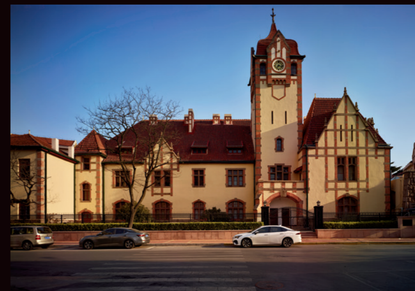
湖北路德国胶澳警察署旧址