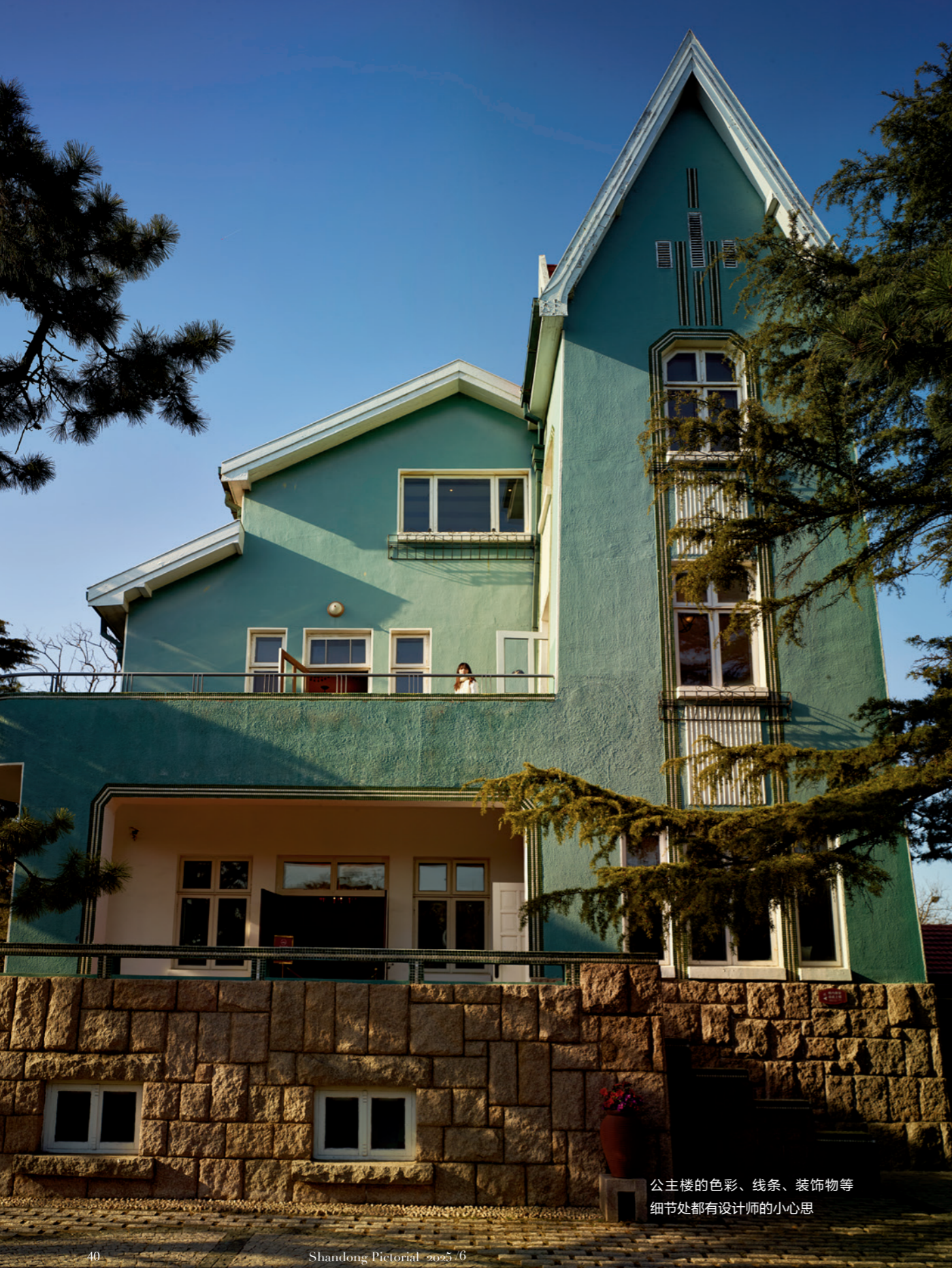
公主楼的色彩、线条、装饰物等 细节处都有设计师的小心思