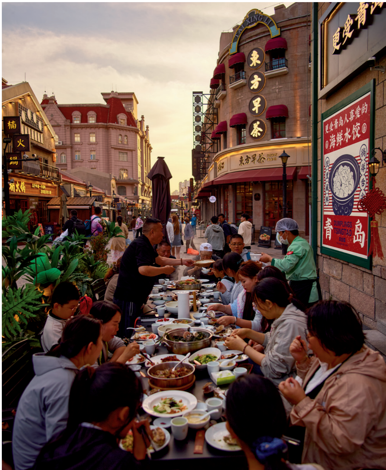
可口中餐带来极致享受，德式浪漫也是。路两侧的复古招牌复刻了昔日里院沿街繁华商业氛围和动人的烟火气