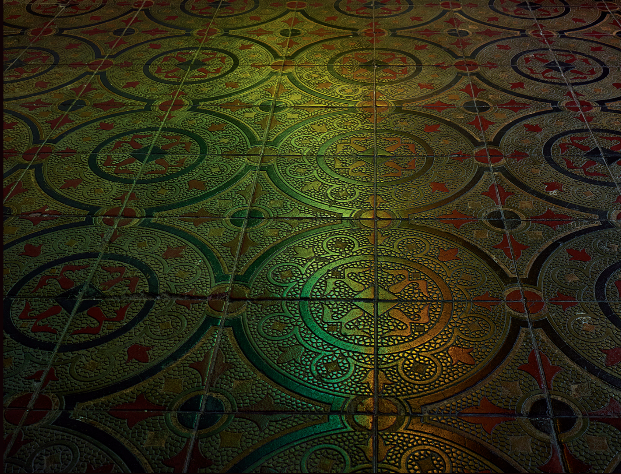
图案繁缛、做工精细的地砖上映射出彩色玻璃的光影