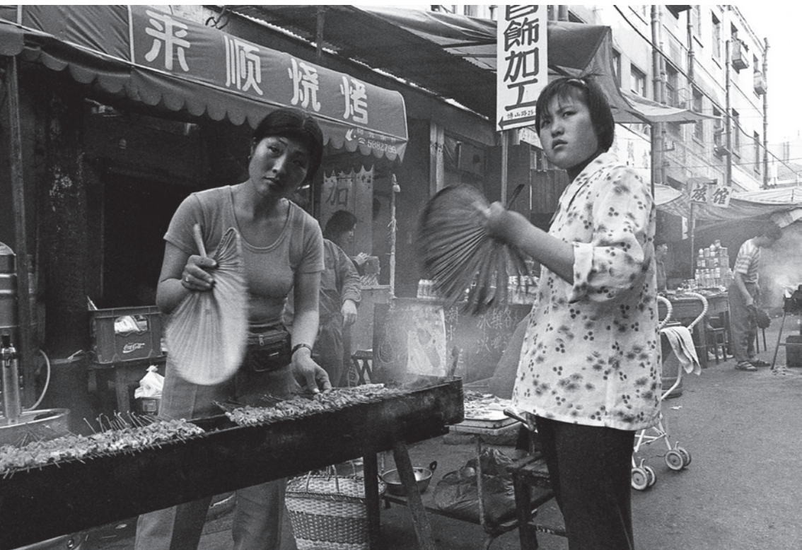
1993 年 博山路烧烤摊