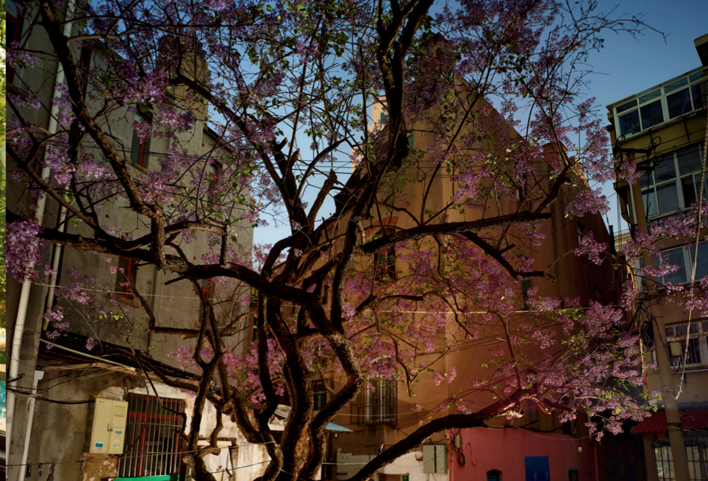
偶然间看到小院里盛开的丁香，就像歌词中美丽编织的梦