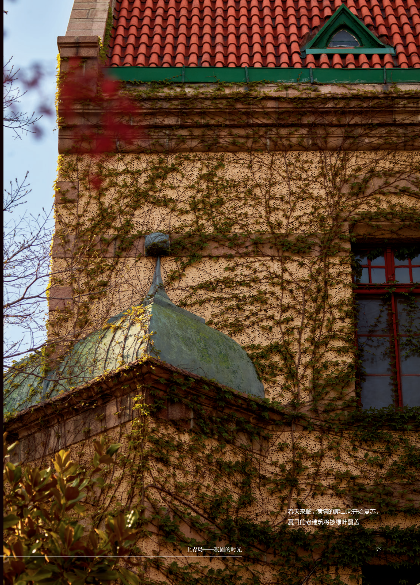
春天来临，满墙的爬山虎开始复苏， 夏日的老建筑将被绿叶覆盖