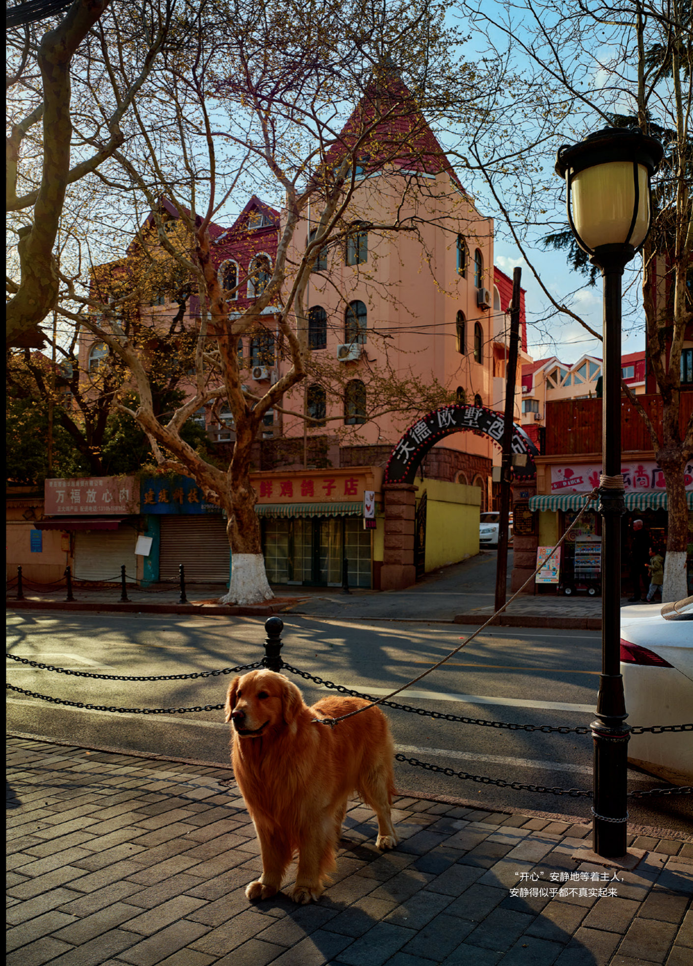
“开心”安静地等着主人， 安静得似乎都不真实起来