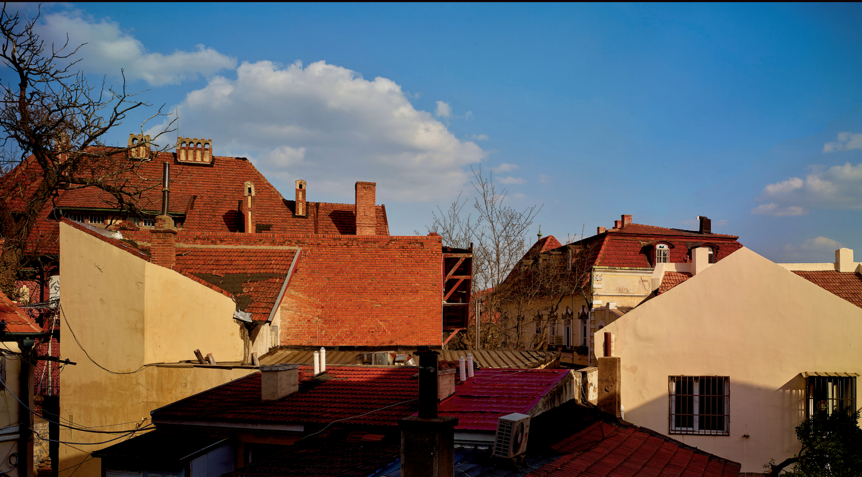
线条、色彩、光影，青岛的美在于自然与匠韵的和谐统一，处处是画作