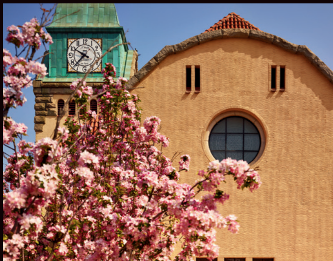
江苏路基督教堂的窗户，像一幅颇有喜感的卡通面孔

到20世纪二三十年代，青岛主权收回之后，年轻的中国设计师们登场了，尤其是30年代，青岛新增建筑的设计，几乎全由中国本土设计师主导。他们一方面延续青岛早期建筑设计理念，同时发挥自己所学，开创出新的风格，让青岛的建筑充满了个性。