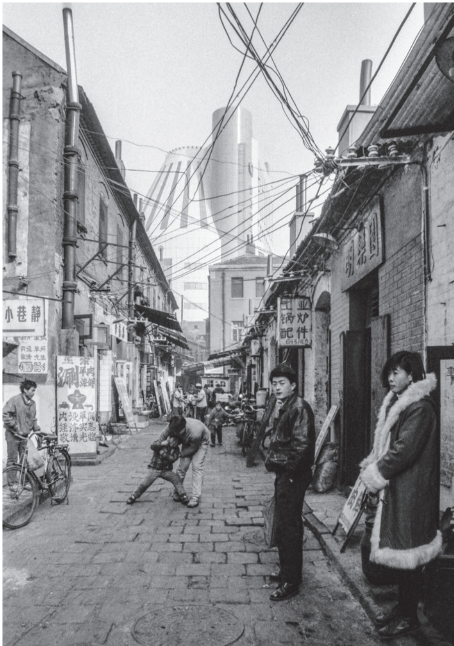
1995年 江宁路，劈柴院，时髦的青年人