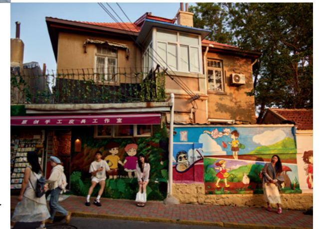
走上龙江路就走进了宫崎骏的漫画世界