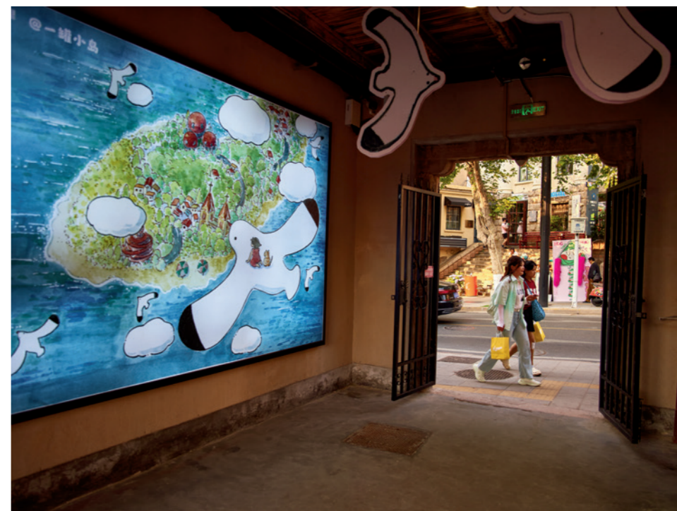
把可爱融进青岛的街头巷尾