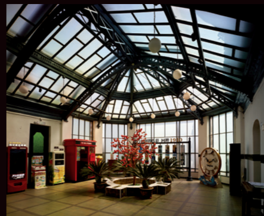
岛城的阳光每天都会准时投射进总督别墅的阳光房

确定青岛最初建筑风格的自然是德国人。德国强租青岛之后的城市规划，如同在一张白纸上作画，可以随心所欲完全按照自己的意愿行事。19 世纪末 20 世纪初，真正在青岛生活的德国人，不到青岛总人口的 5%。如果让这些入住进传统中式建筑里，不仅会大大抵消他们作为征服者的心理优势，更会增加他们“独在异乡为异客”的孤独感。据说，德国总督屈珀尔的想法很明确，就是通过一系列具有德国风情的建筑，来营造一个可以让德国人安心住在异乡的场景。