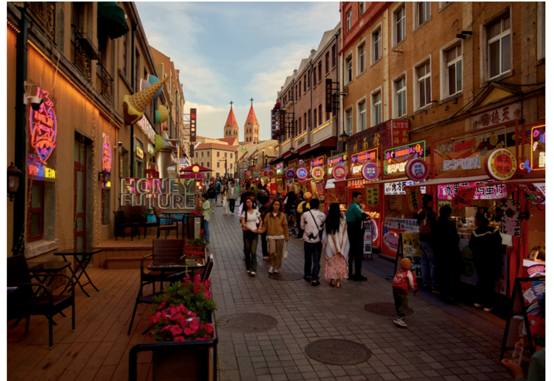
精致的霓虹，即将打开上街里斑斓的夜

如果不经特别提示，恐怕最地道的山东人也不会把青岛最时尚的「上街里」往最地道的方言上琢磨。