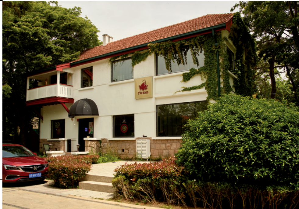
法国建筑师白纳德设计的别墅，建于 1930 年

采访当日，在大大的草坪上正在举行户外婚礼。欧式花园、百年绿树环绕，远眺还能看到海景，在此举行婚礼真是具有天然的浪漫氛围。 在庭院里闲逛，随处可见的喷泉、鲜花、雕塑，令你产生误入艺术殿堂的感觉。松柏郁郁葱葱，满目苍翠。