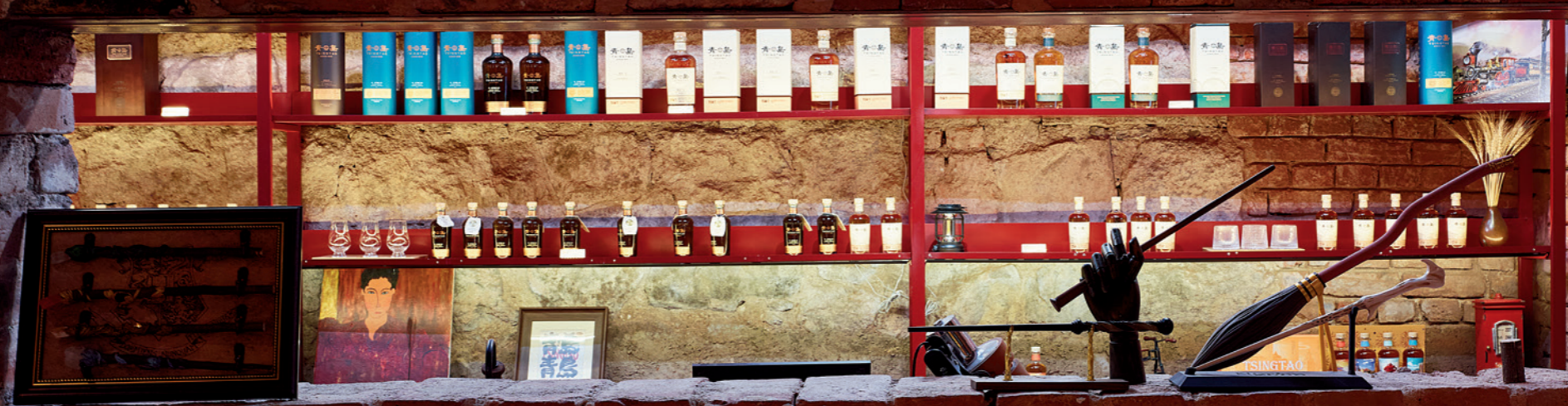
为红色砖墙开辟一处窗口，只为收藏“别具匠心”

第一次去银鱼巷是一个夏 天的晚上。日间，胶济铁路通 车一百二十周年的活动结束后 后，被青岛当地人「安利」重 装上阵的银鱼巷很值得一逛。 关键是，这条小街距离青岛火 车站步行不超过十分钟。