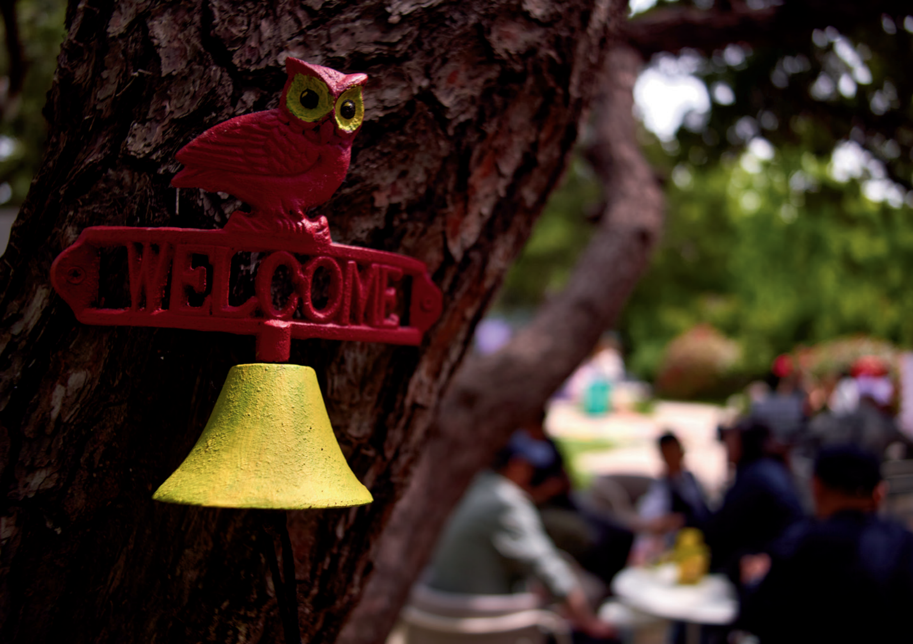
太平角 18 号，青岛首家花园式、沉浸式的艺术中心