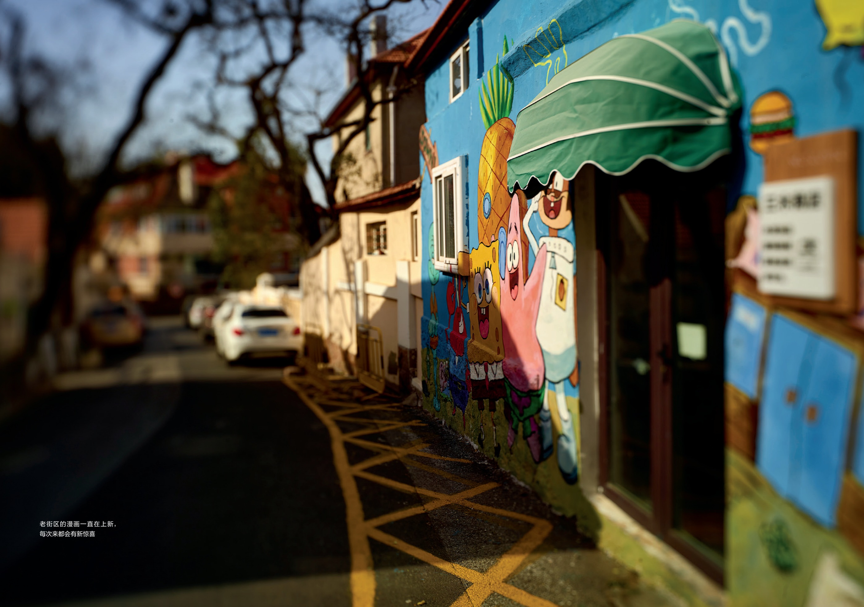
老街区的漫画一直在上新， 每次来都会有新惊喜