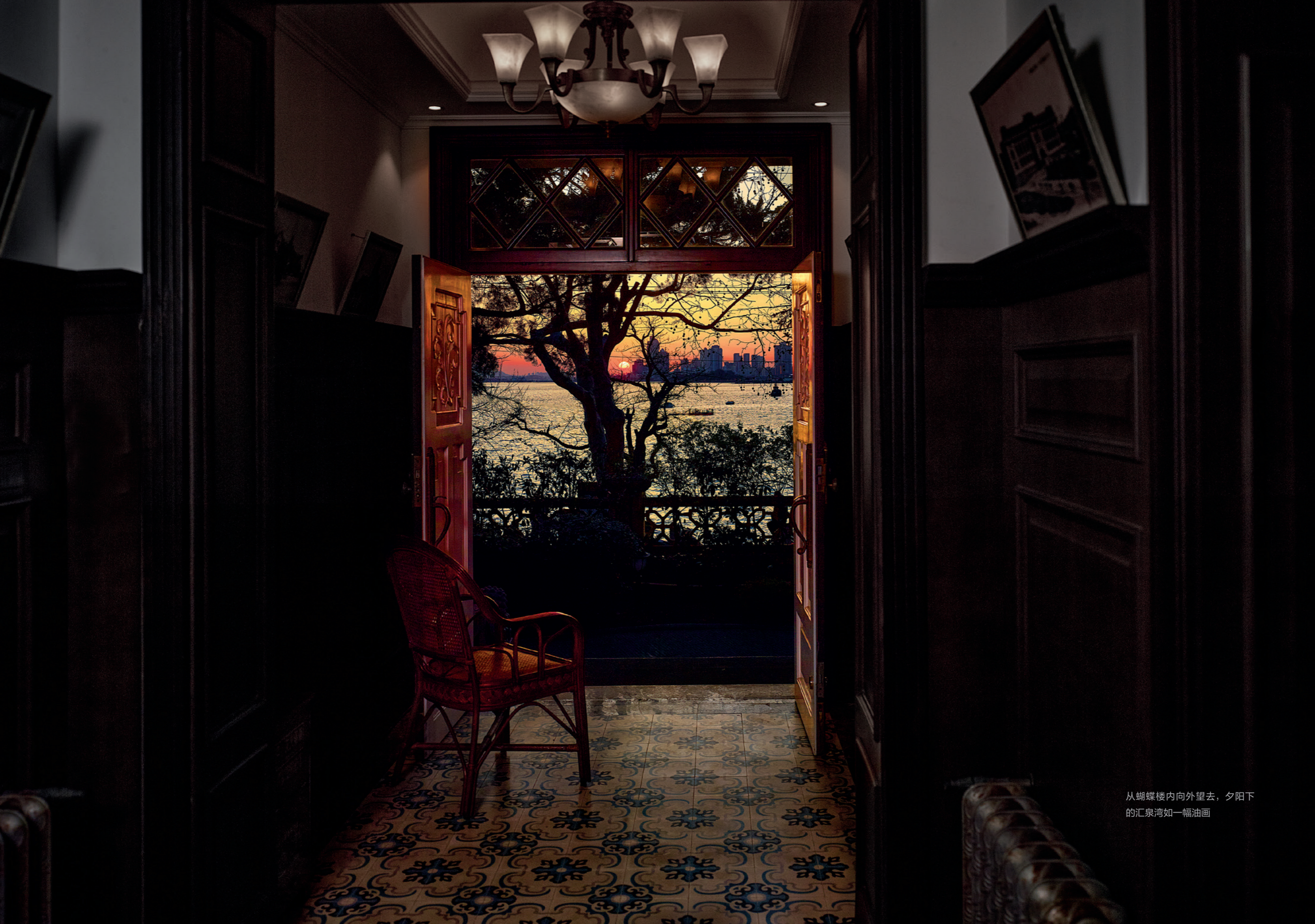
从蝴蝶楼内向外望去，夕阳下的汇泉湾如一幅油画