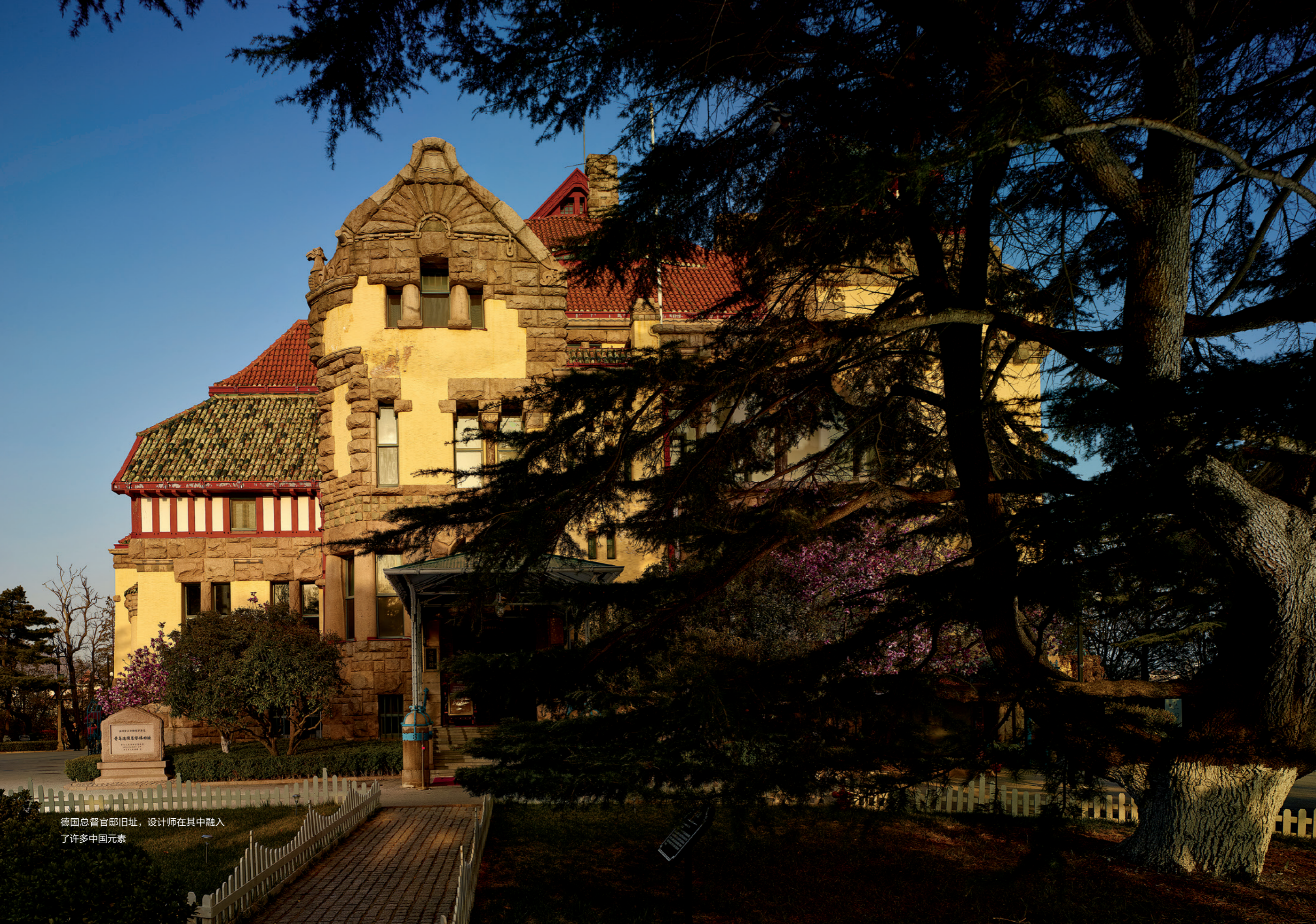
德国总督官邸旧址，设计师在其中融入了许多中国元素