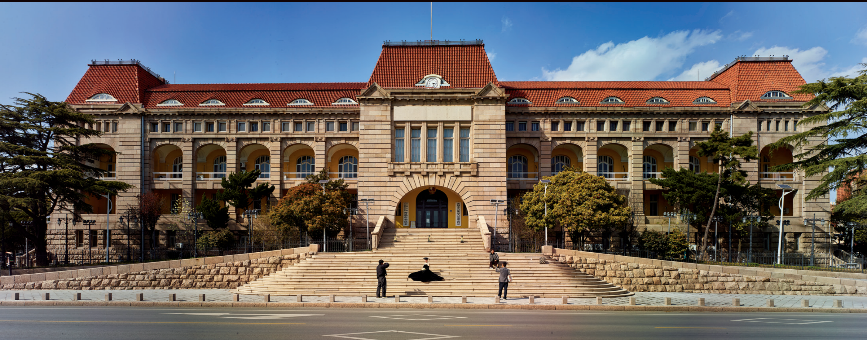
胶澳总督府旧址成为年轻人拍照的热门取景地