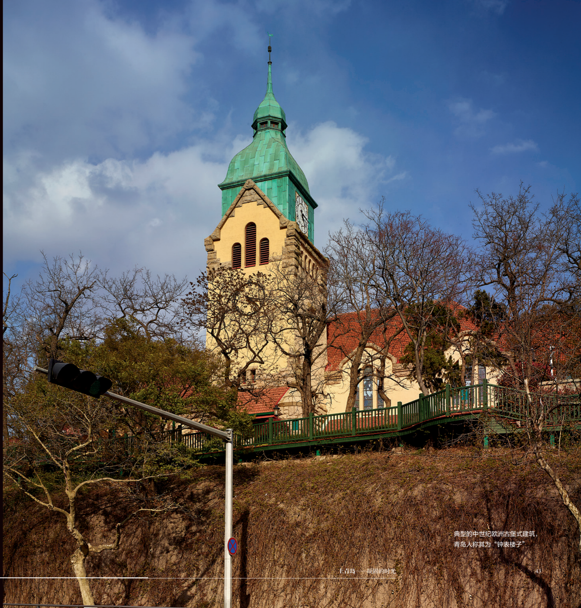
典型的中世纪欧洲古堡式建筑，青岛人称其为“钟表楼子”