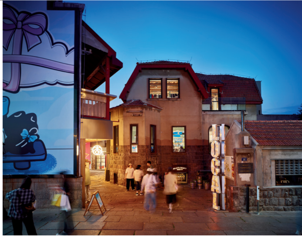
漫画、窗景、灯火、招贴……银鱼巷的吸引力体现在丰富而多样的细节里