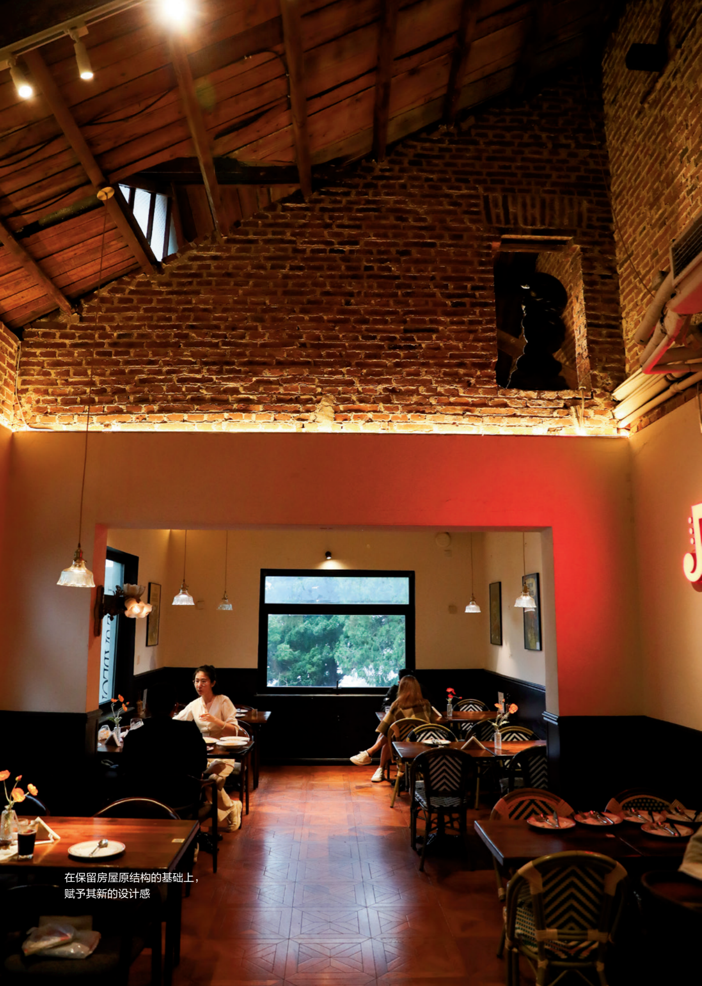
在保留房屋原结构的基础上，赋予其新的设计感