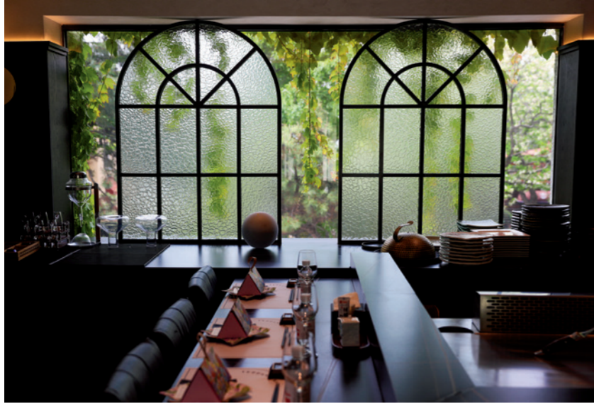
磨砂玻璃与垂落的爬藤组成一幅天然壁画