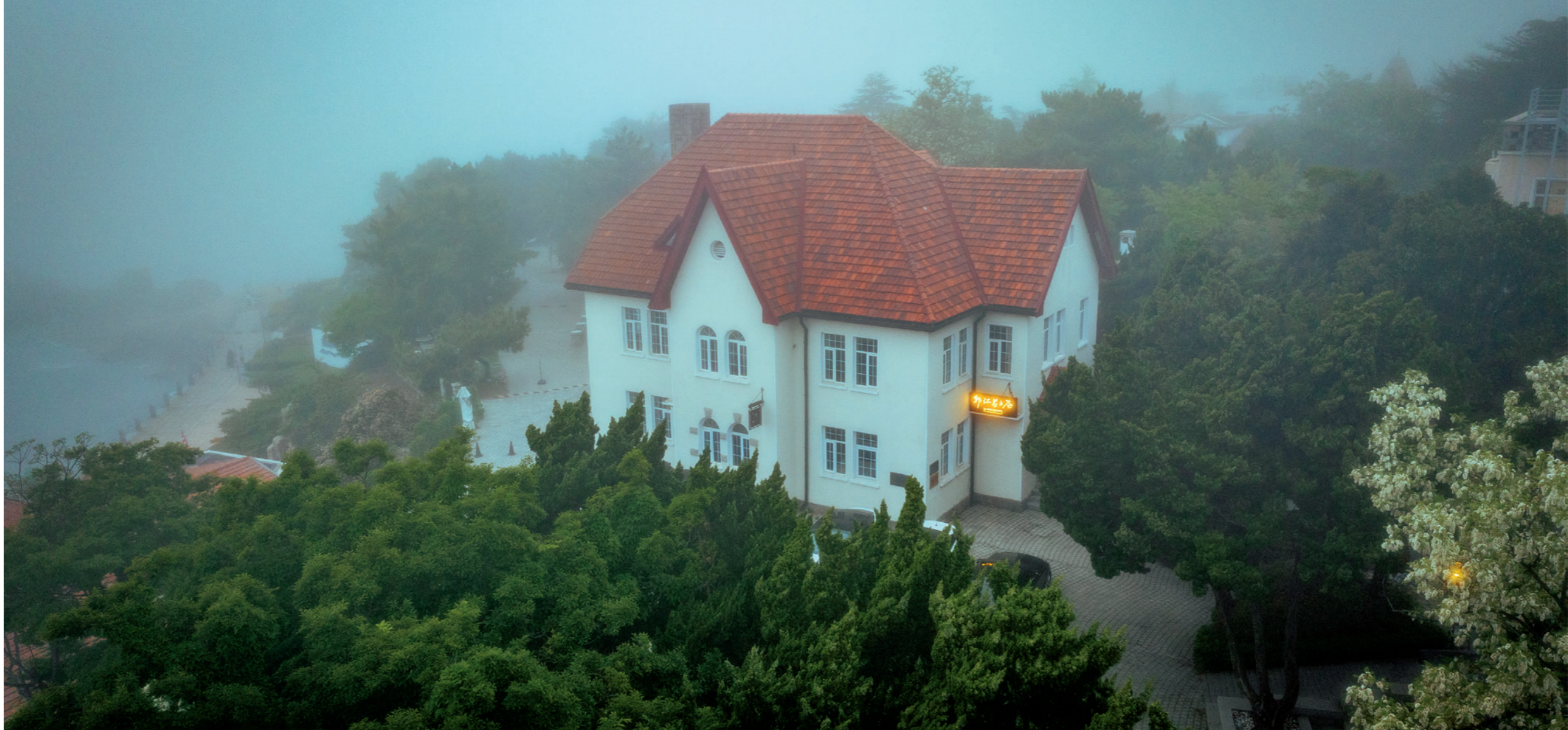
平流雾中的红瓦绿树多了一份迷离