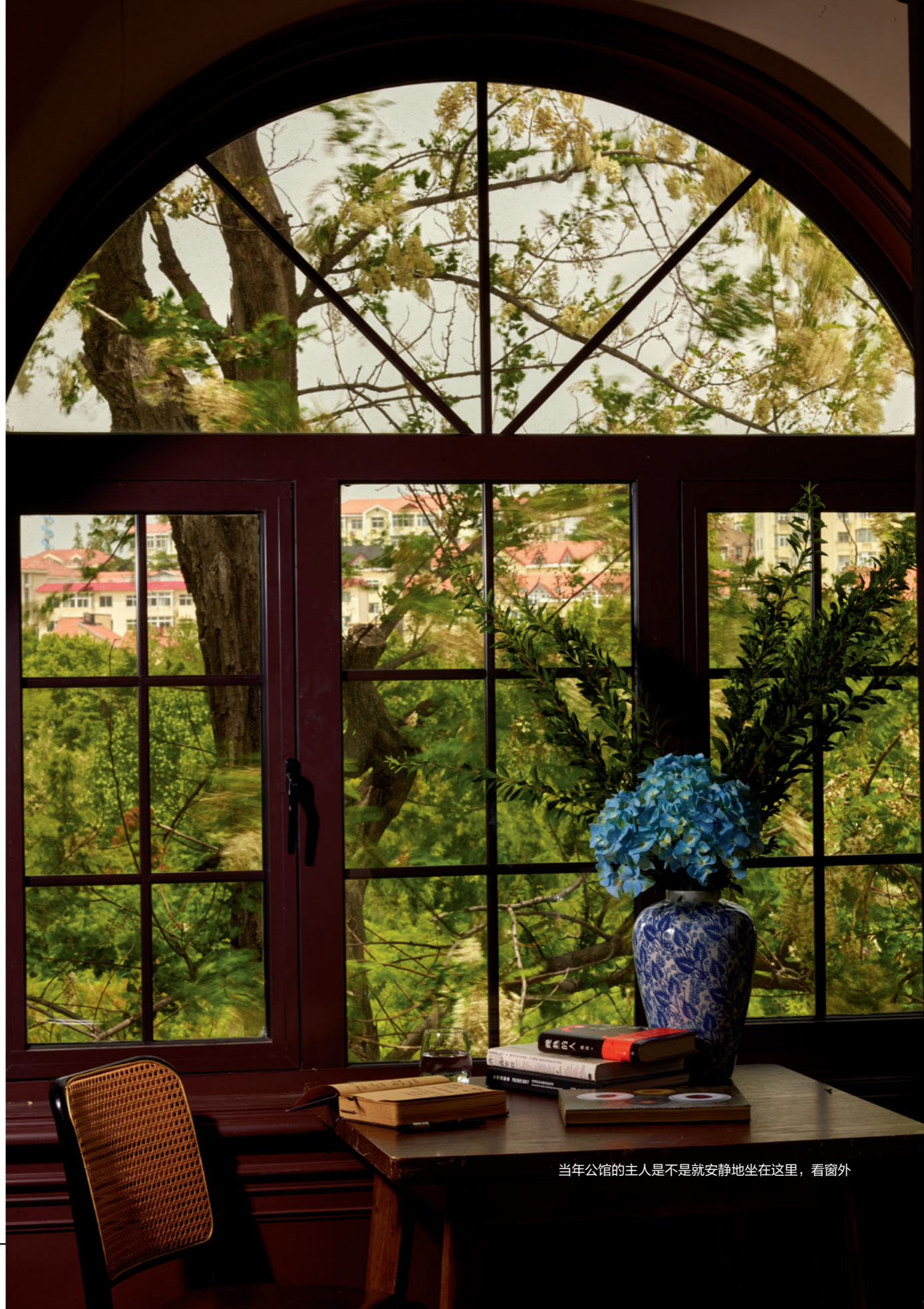
当年公馆的主人是不是就安静地坐在这里，看窗外