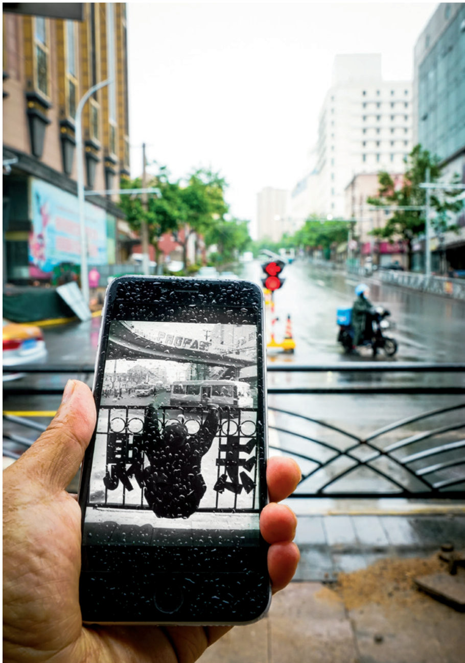
【同框】 1995年与2020年，胶州路 同一位置面貌的变迁。