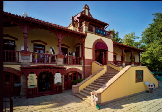
左上：胶澳帝国邮政局旧址，现为青岛邮电博物馆 右上：青岛啤酒博物馆 左下：安徽路小红楼美术馆 右下：康有为故居