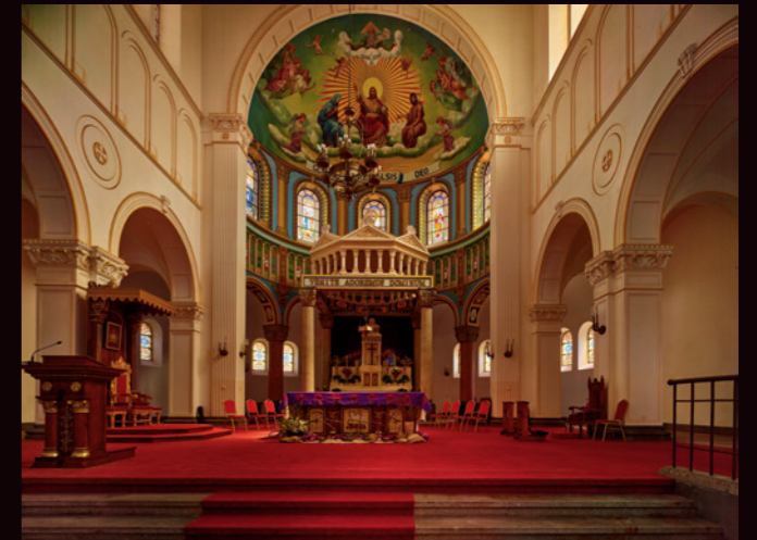
中山路上的地标建筑之一，圣弥厄尔天主教堂