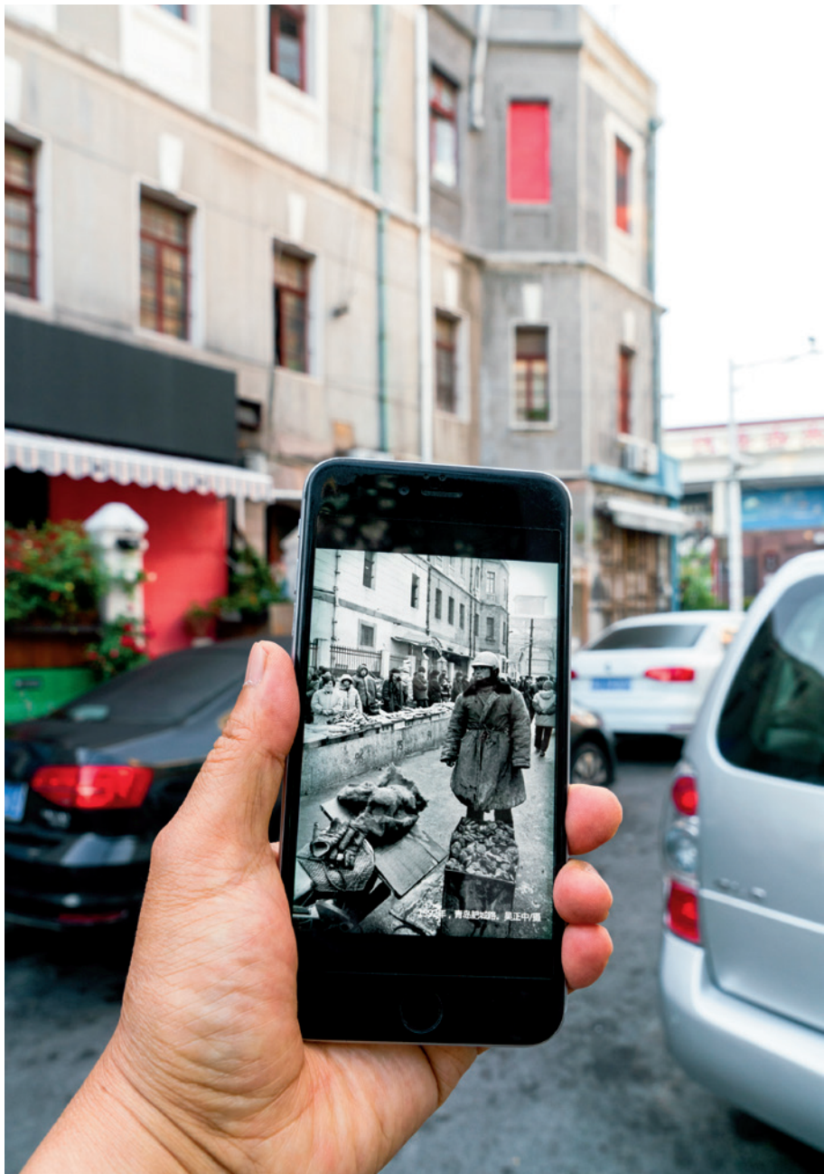
【同框】 1987年与2020年，肥城路 同一位置面貌的变迁。