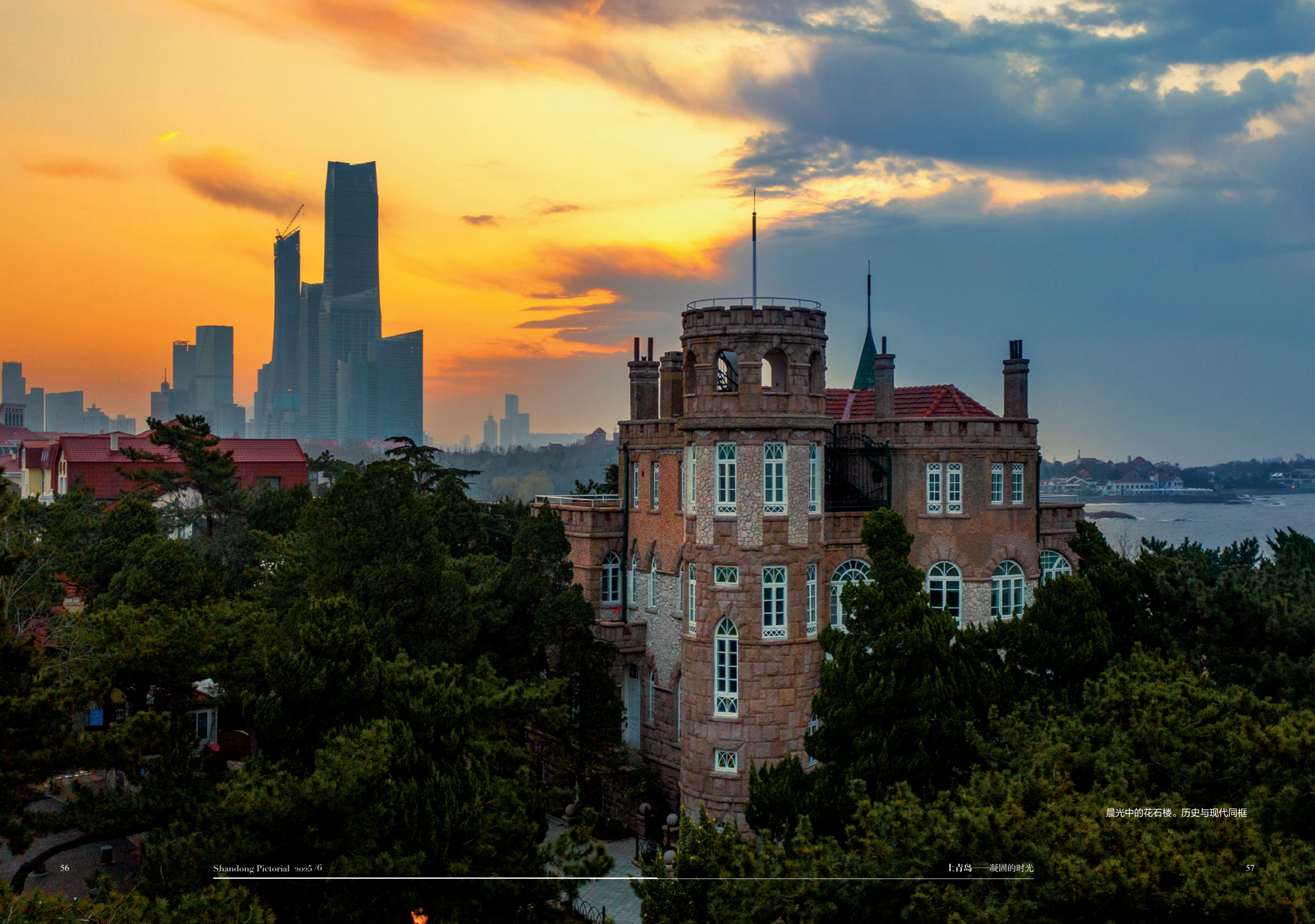
晨光中的花石楼。历史与现代同框