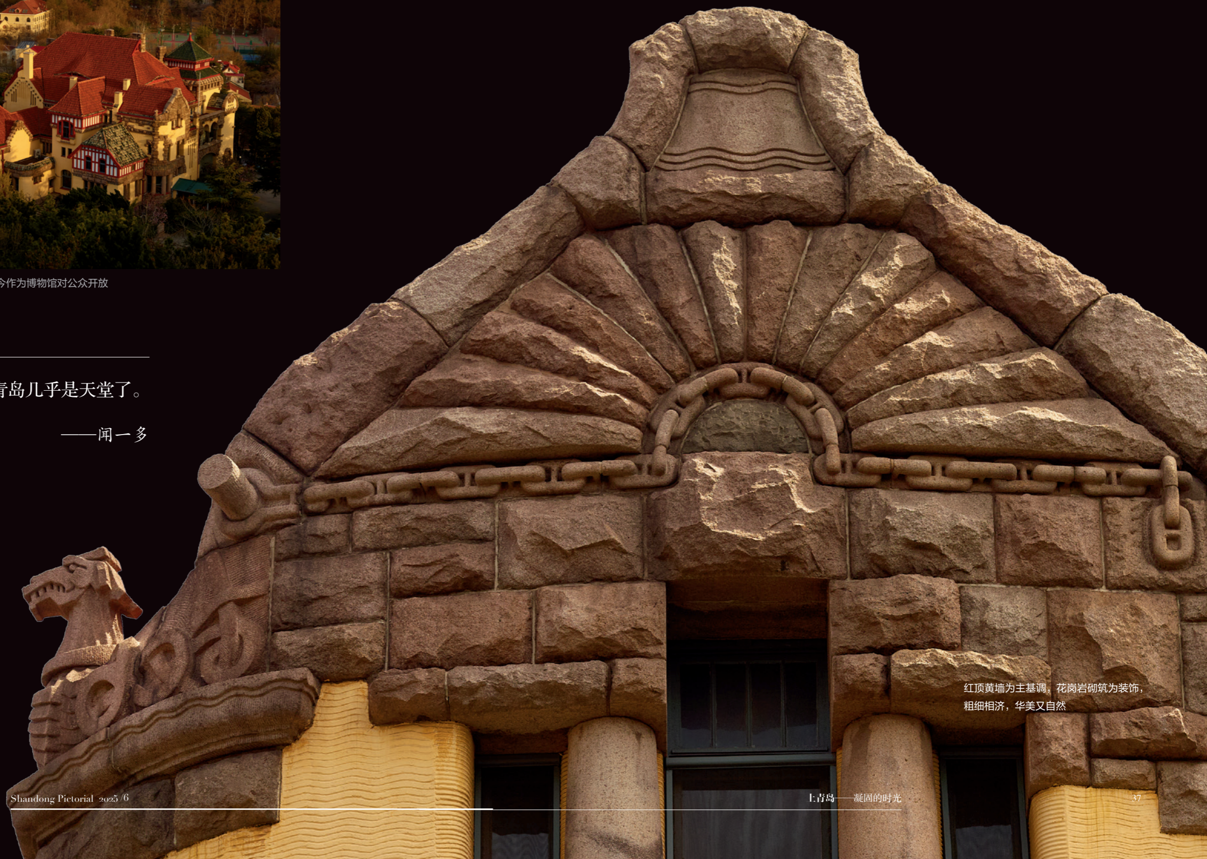
红顶黄墙为主基调，花岗岩砌筑为装饰，粗细相济，华美又自然