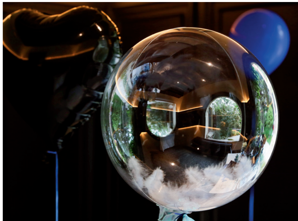
老房子太美，有时显得颇为虚幻