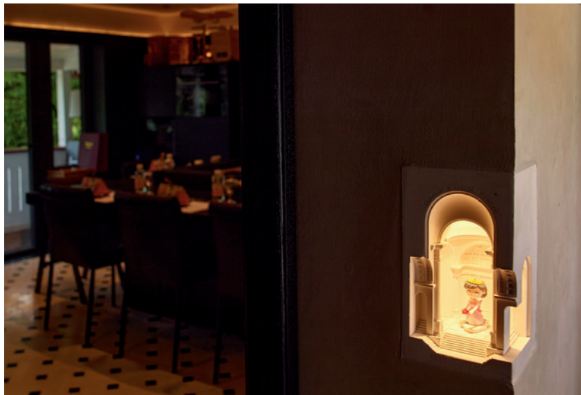
艺术创造藏在不经意间偶遇的角落里