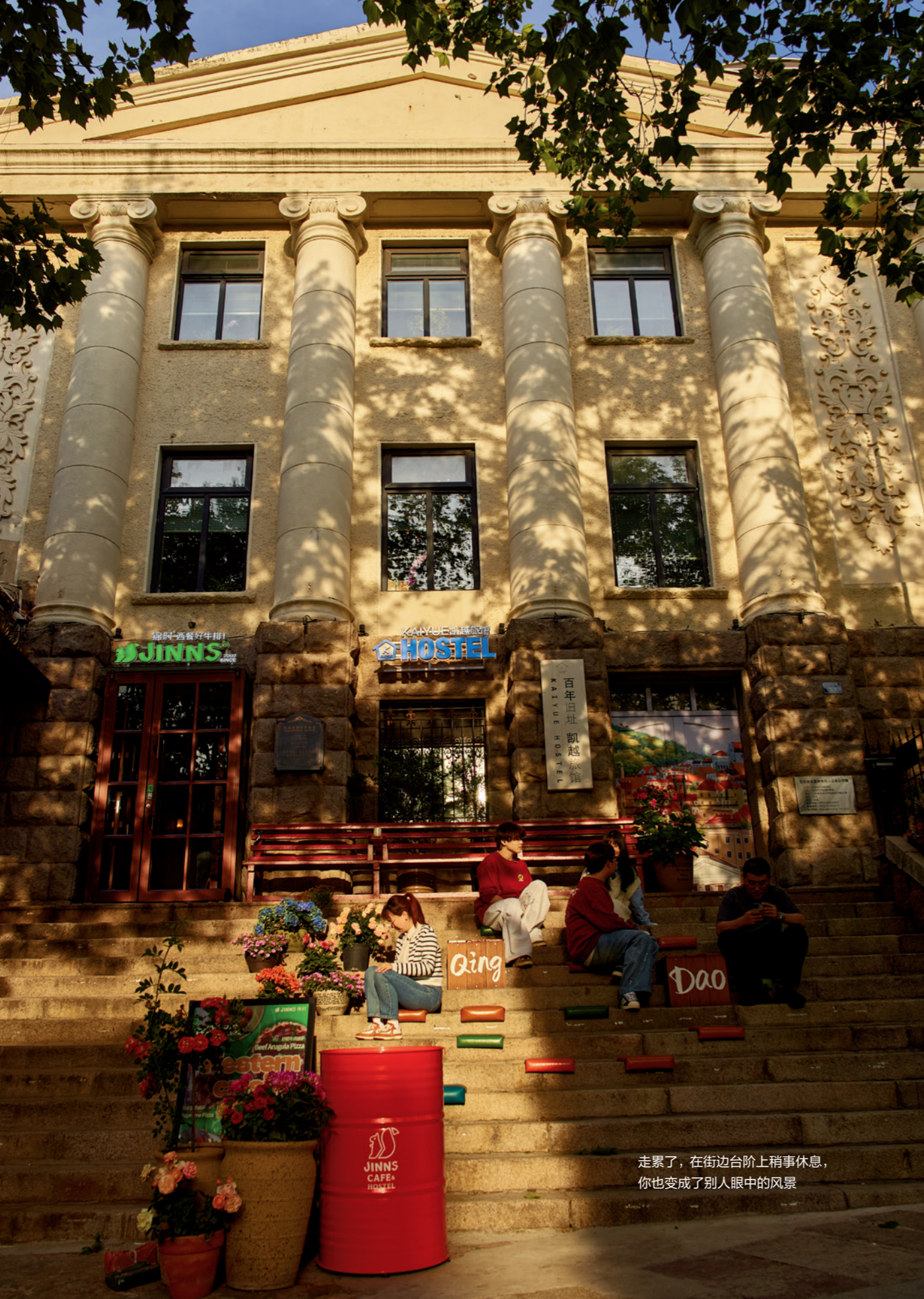
走累了，在街边台阶上稍事休息，你也变成了别人眼中的风景