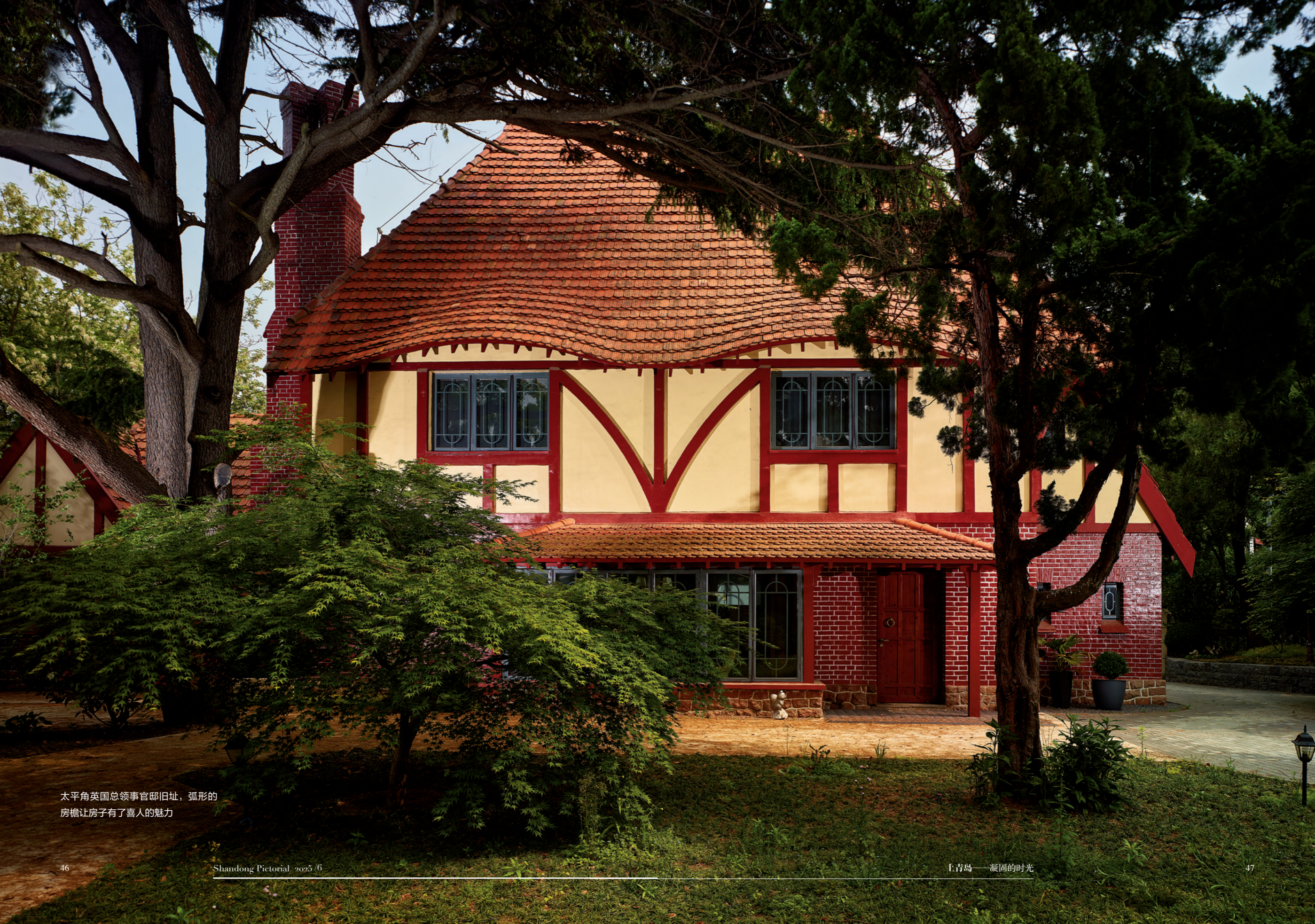
太平角英国总领事官邸旧址，弧形的房檐让房子有了喜人的魅力