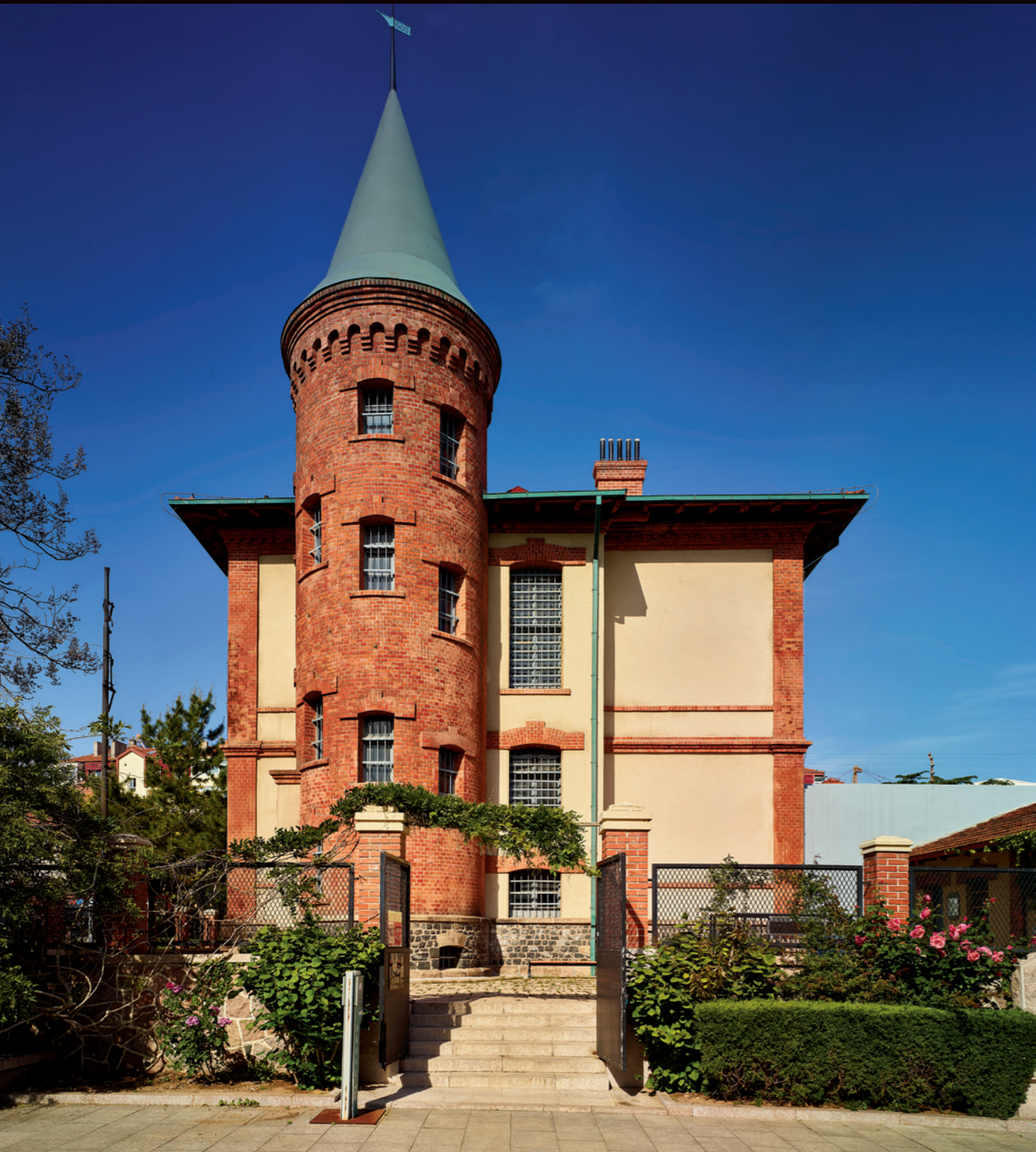
德国监狱旧址，厚重的砖墙，高高的塔楼，古典而神秘

传统烧制瓦，德国人生产的红瓦样式也丰富得多，有马蹄瓦、筒瓦、脊瓦、牛舌瓦、方瓦、蝴蝶瓦等等，这也使得青岛的建筑因为不同形态瓦的使用，而更具观赏性。