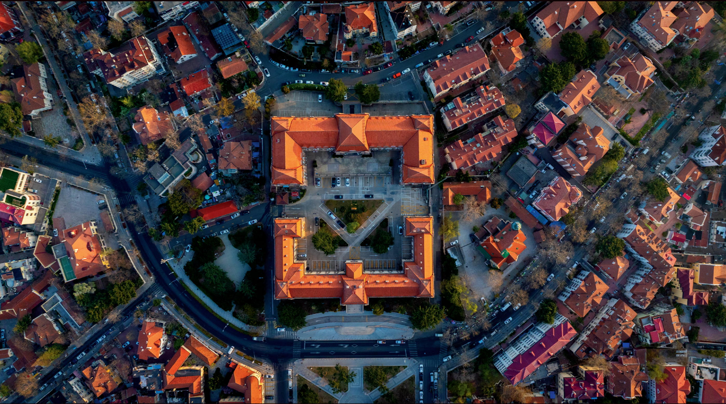
德国人规划的青岛城，似规整又似杂乱无序