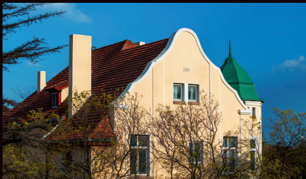
青岛路1号德国领事馆旧址