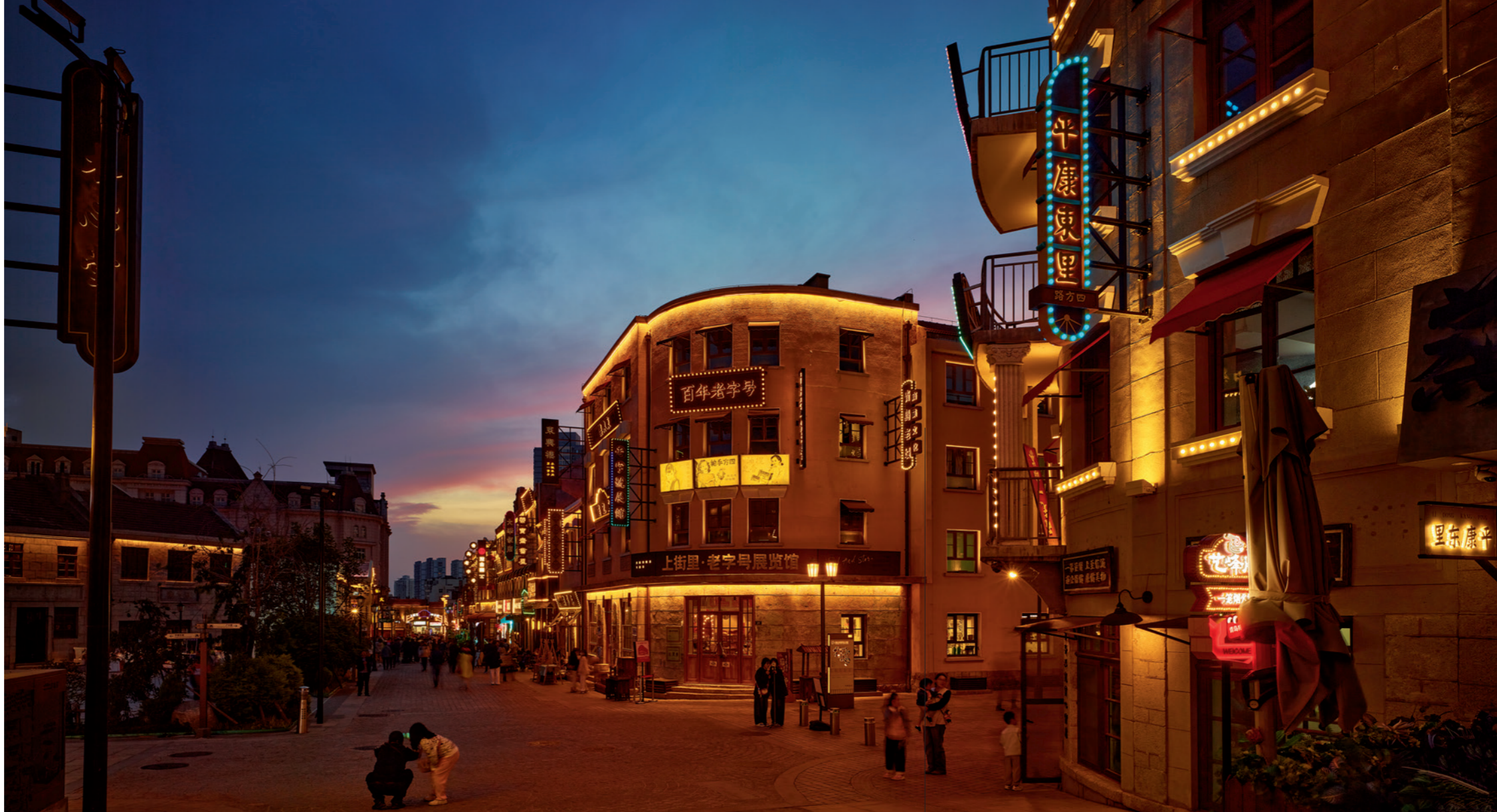
在日夜交接的蓝调里，梦回旧时青岛，四方路的繁华再现

白的灯台，红的屋瓦，弯曲的海岸，点点的近岛遥山，就净现上你的视界里来了，这就是青岛。