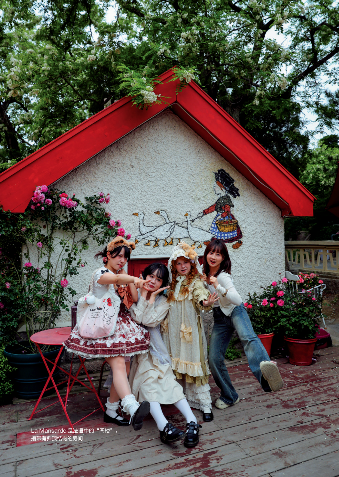
La Mansarde 是法语中的“阁楼”，指带有斜顶结构的房间