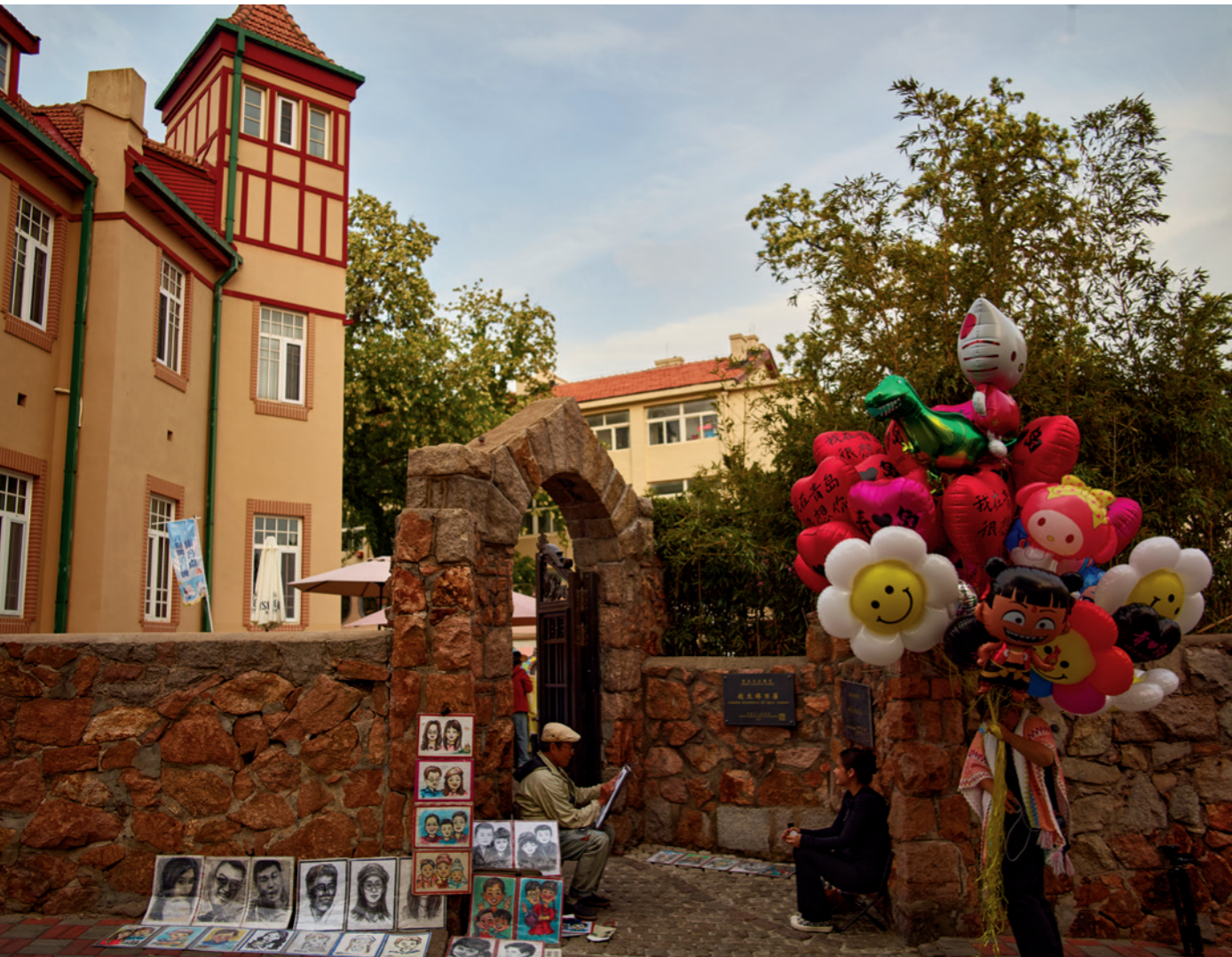
漫画家把游人定格在画板上，游人又把他定格在影像里