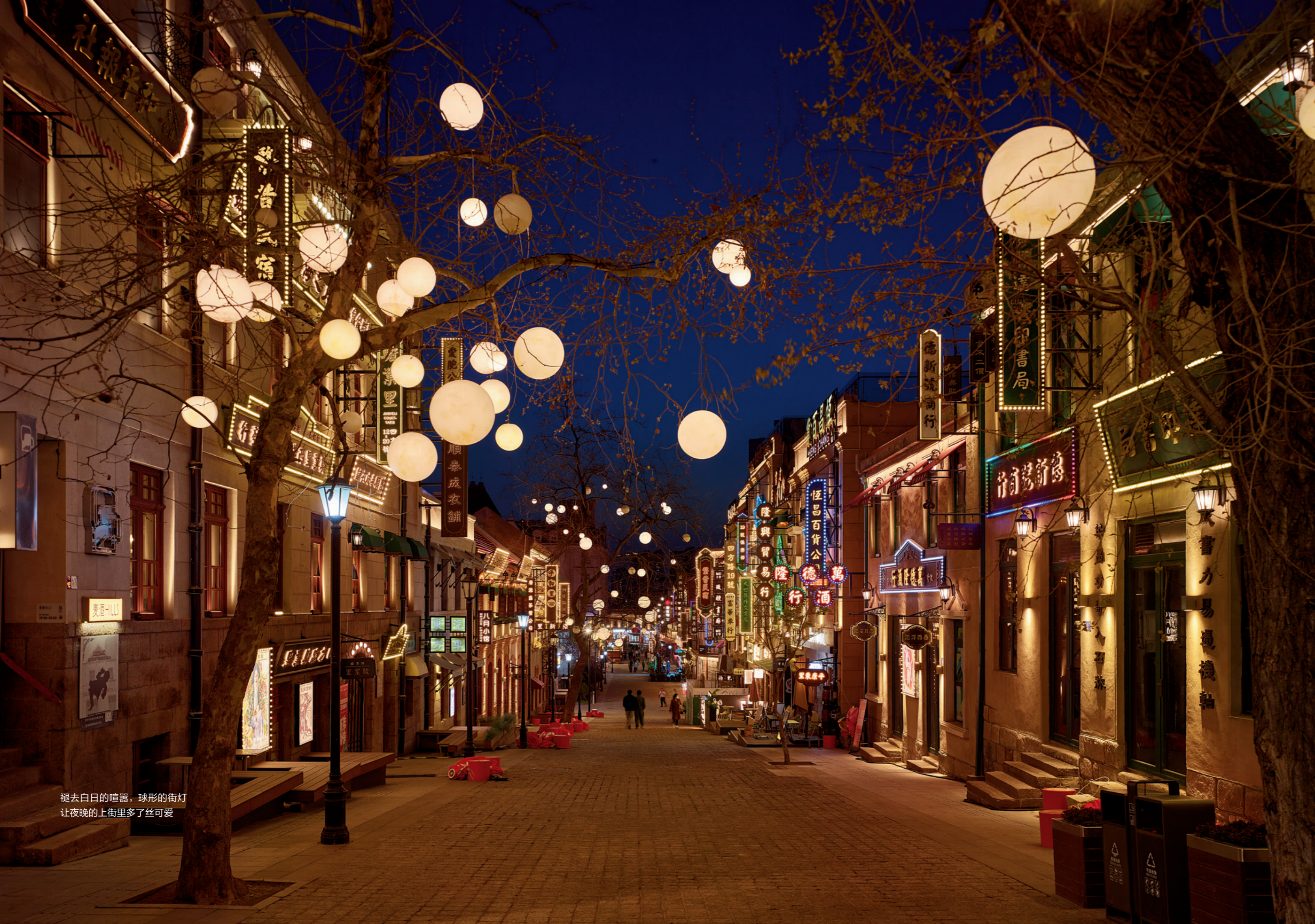
褪去白日的喧嚣，球形的街灯 让夜晚的上街里多了丝可爱