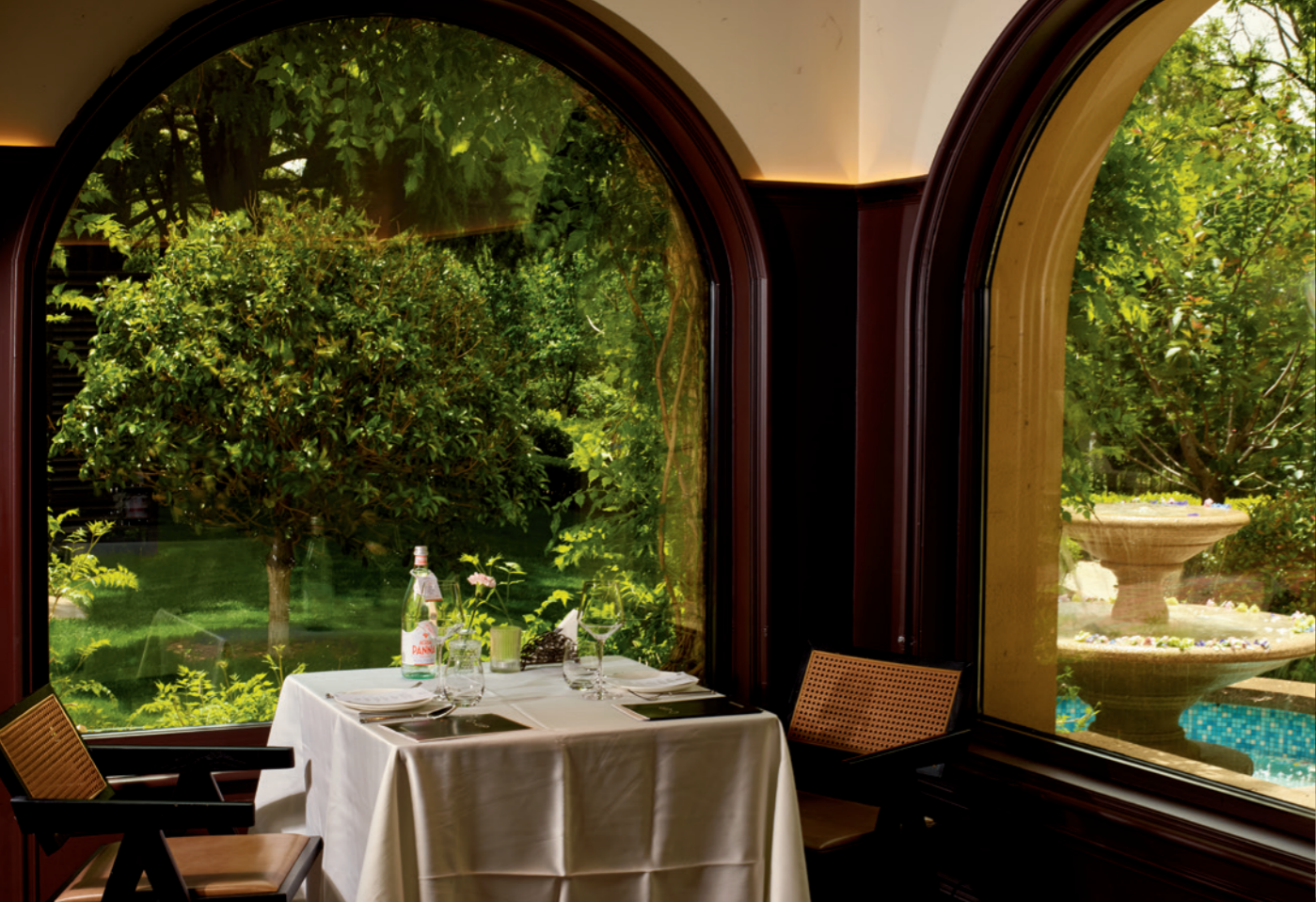
C-UP 宋公馆餐厅一角，花与酒装点的生活