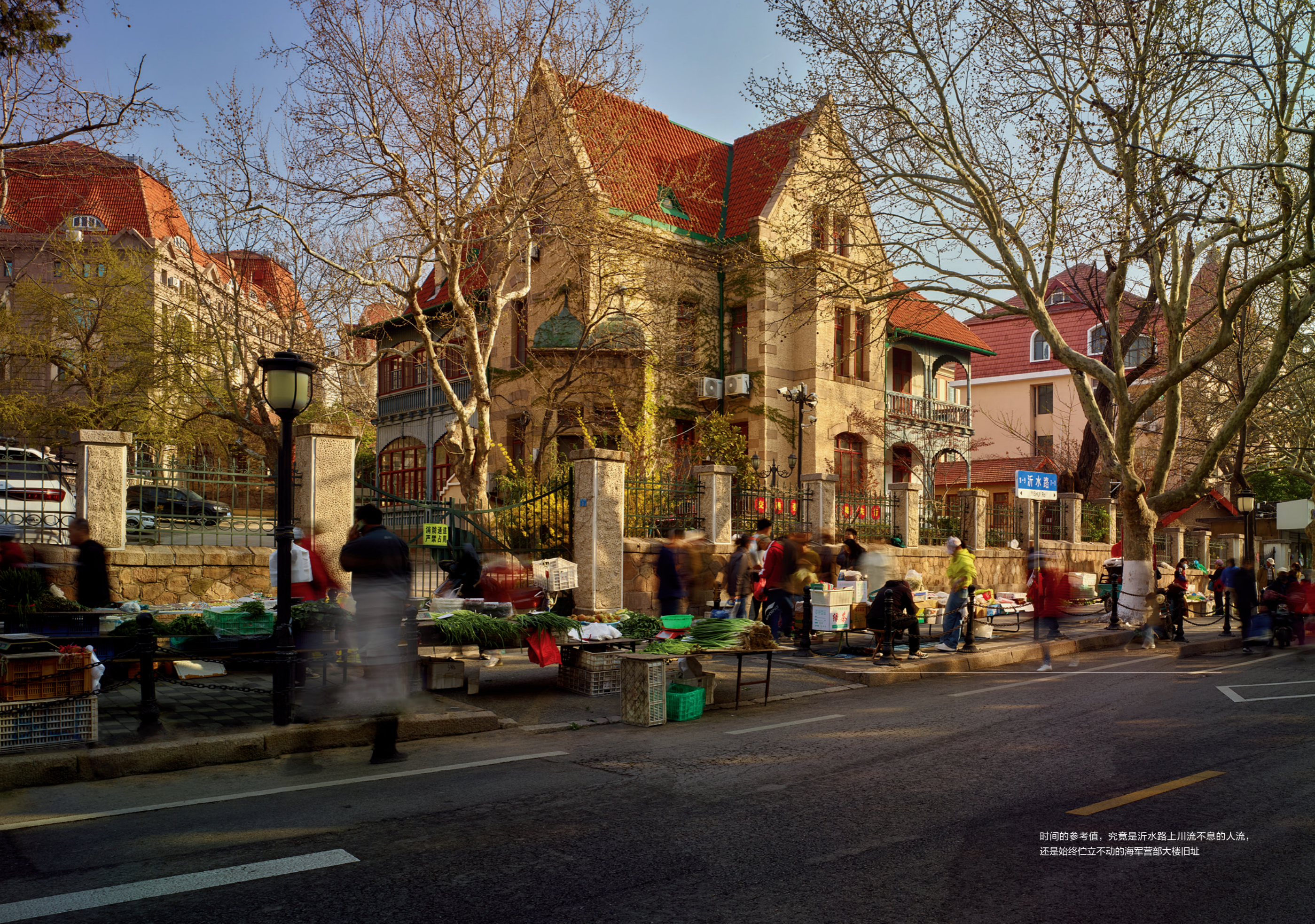
时间的参考值，究竟是沂水路上川流不息的人流，还是始终伫立不动的海军营部大楼旧址