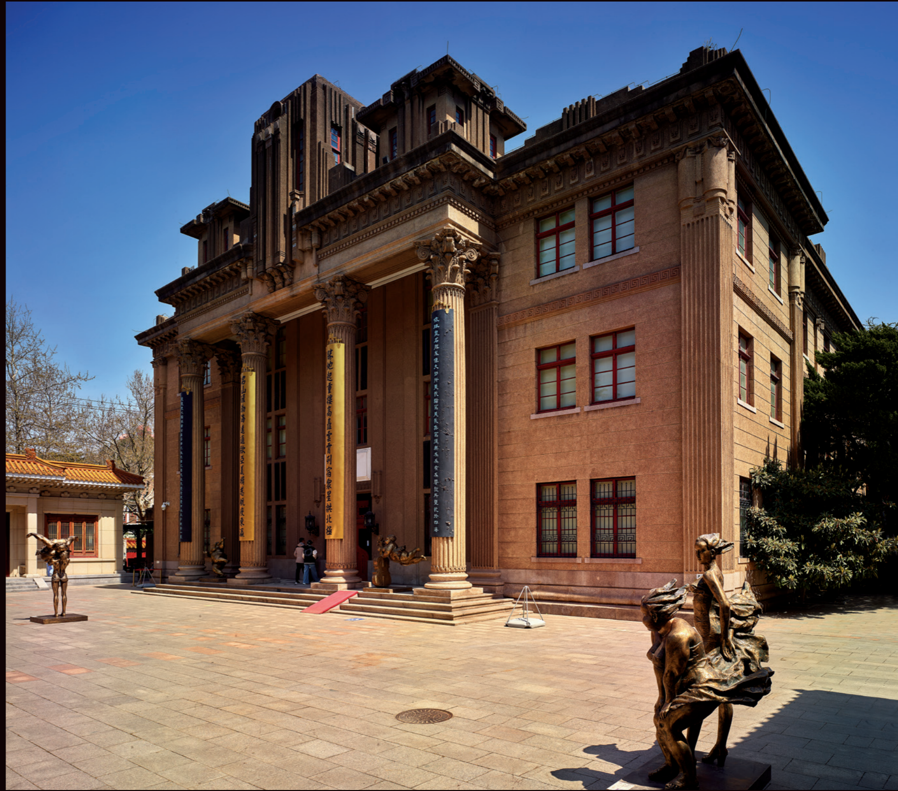
青岛市美术馆融合罗马柱廊式风格的主体建筑，其后的二进与三进则分别是中国宫殿式和阿拉伯式风格