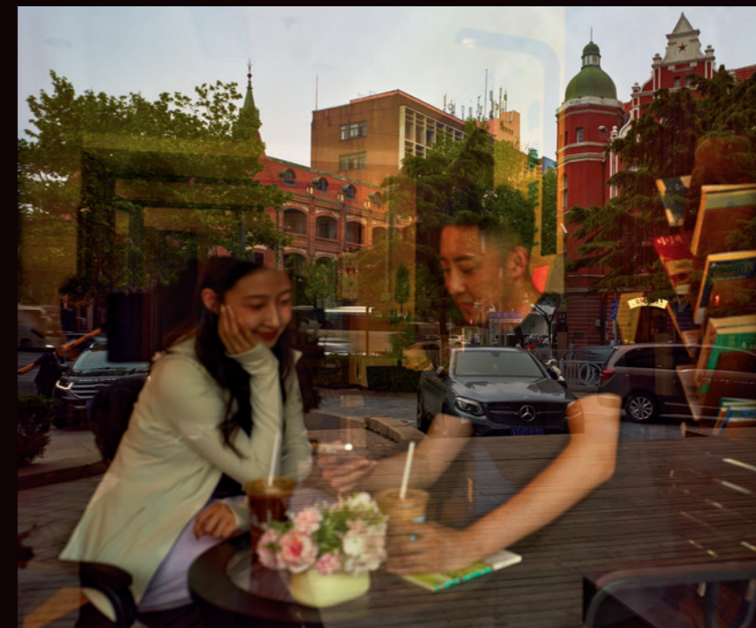
现在与过去，人与建筑，在光影中重合，如同被折叠的时光

套用民国文人的话说，青岛的老别墅，窗子是极好看的。它们有圆有方，有阔有窄，嵌在花岗岩的墙面上，像极了别墅的眼睛，静观鸟城的变迁。