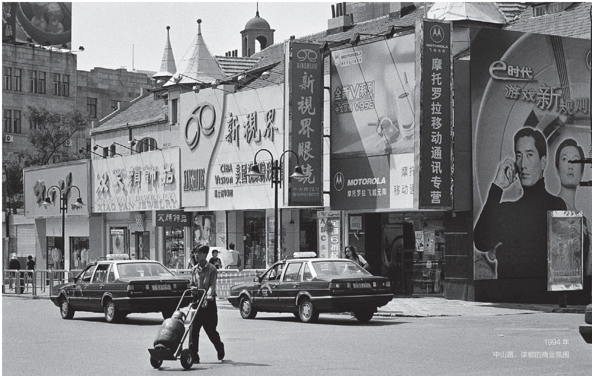
1994年 中山路，浓郁的商业氛围