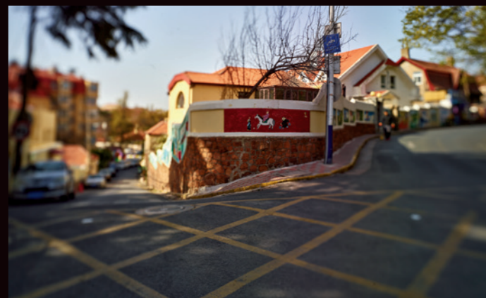
青岛的路依山而建，方向成谜，拐角的风景却因此多变起来

不过细心的人会发现青岛老街区另一个特点——在大鲍岛一带，潍县路、博山路、芝罘路、济宁路、即墨路、胶州路、高密路、海泊路等街道的规划设计则无比规整，宛如一幅整齐的棋盘。这里是典型的中国式“棋盘街”。与欧人别墅区不同，这里就是当年德国人专门辟出的华人居住区。与欧人区宽度超过15米，处处皆是风景的街道的不同，这里的街要窄得多。显然，在德国人眼中，他们规划建设的美丽青岛，只属于欧洲人，不属于华人。