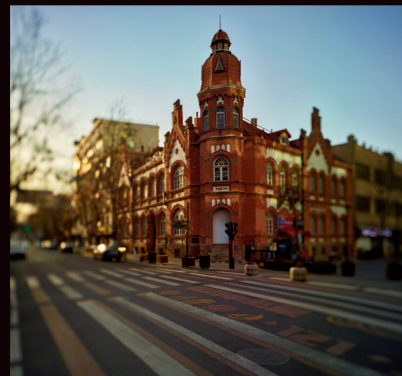
中山路胶州旅馆旧址