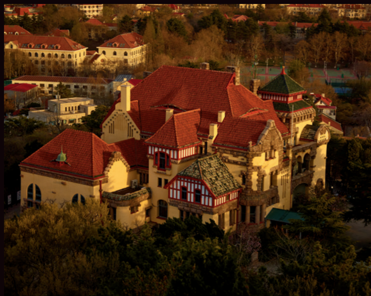
德国总督官邸旧址如今作为博物馆对公众开放