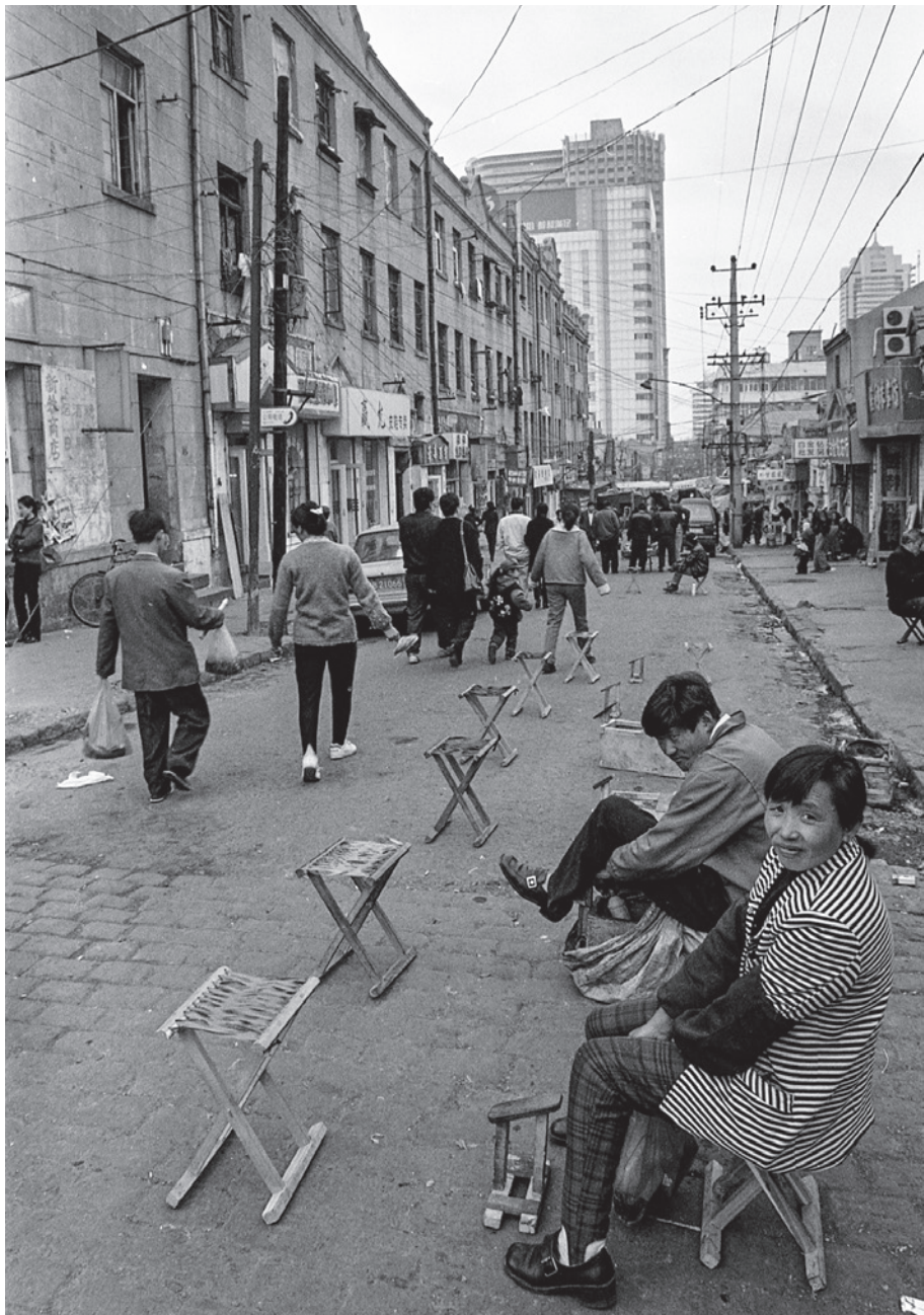
1998 年 潍县路，等待客人的擦鞋工人