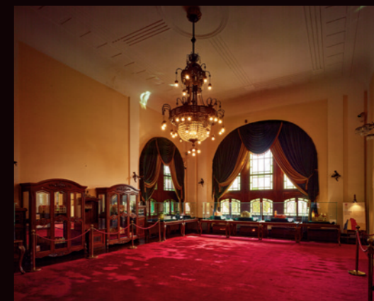
繁复华丽的吊灯凸显整栋建筑的奢华