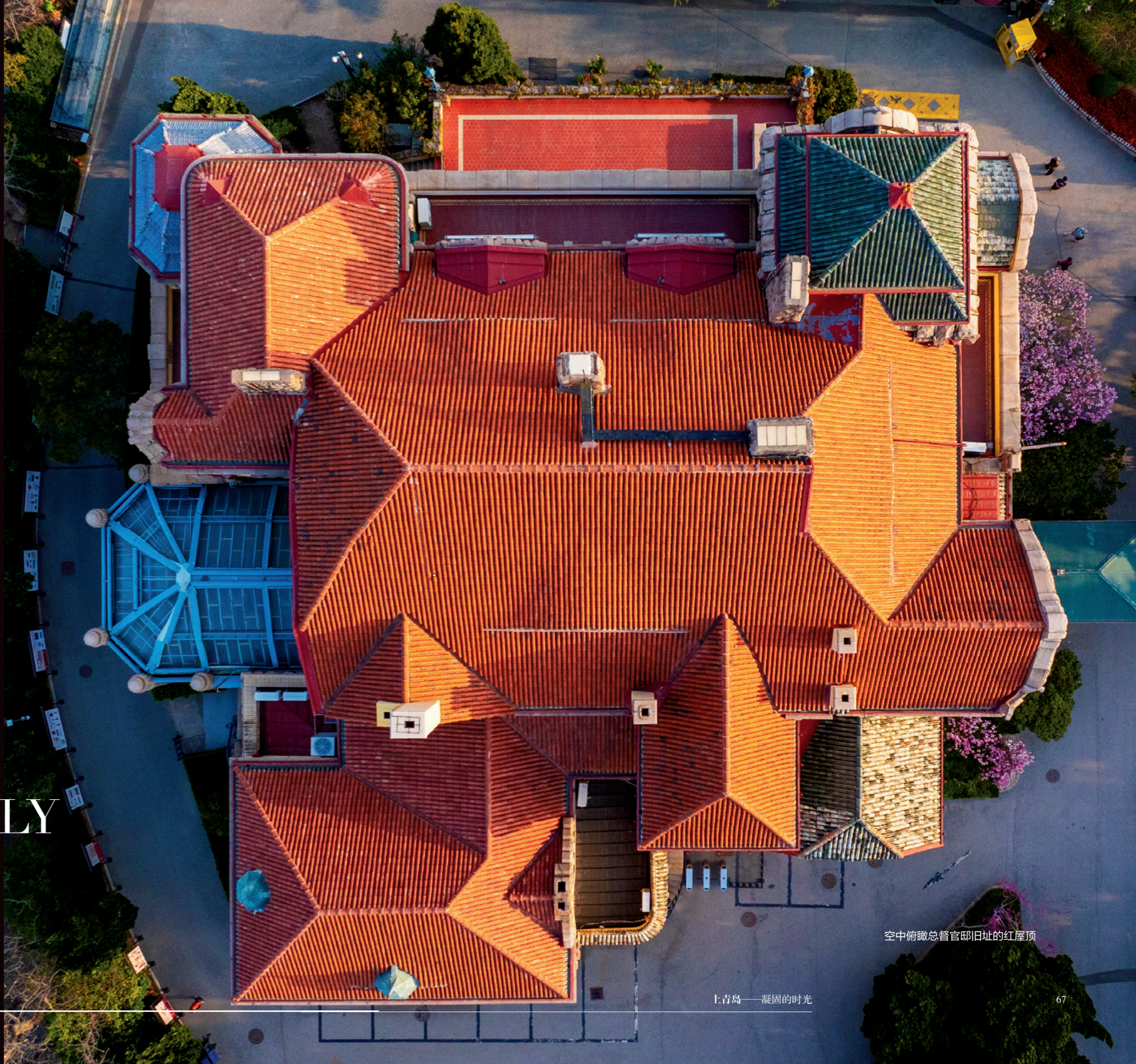
空中俯瞰总督官邸旧址的红屋顶

WHY RED TILES ARE STYLISH ONLY IN QINGDAO