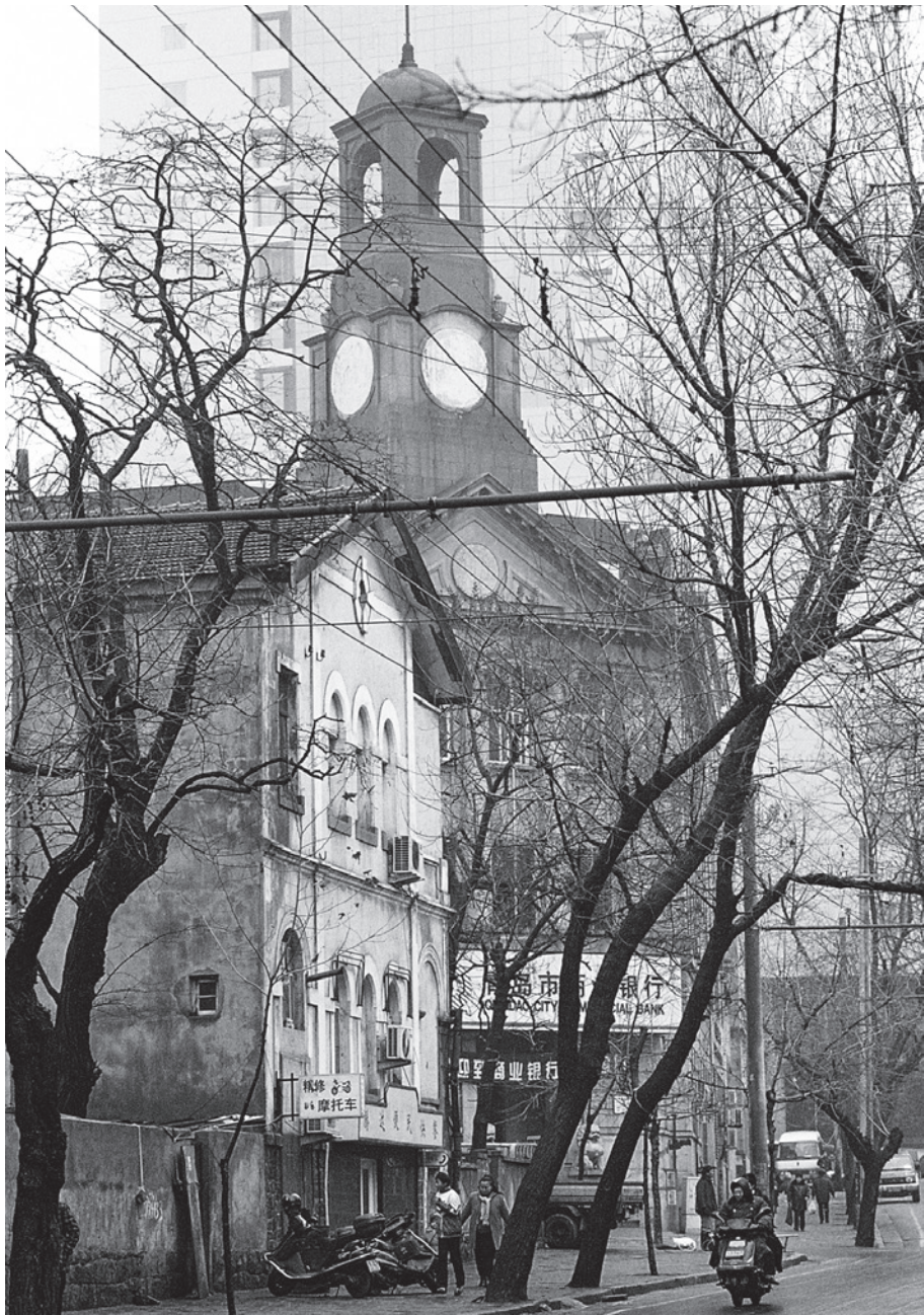
1998 年 河南路，金城银行青岛分行旧址