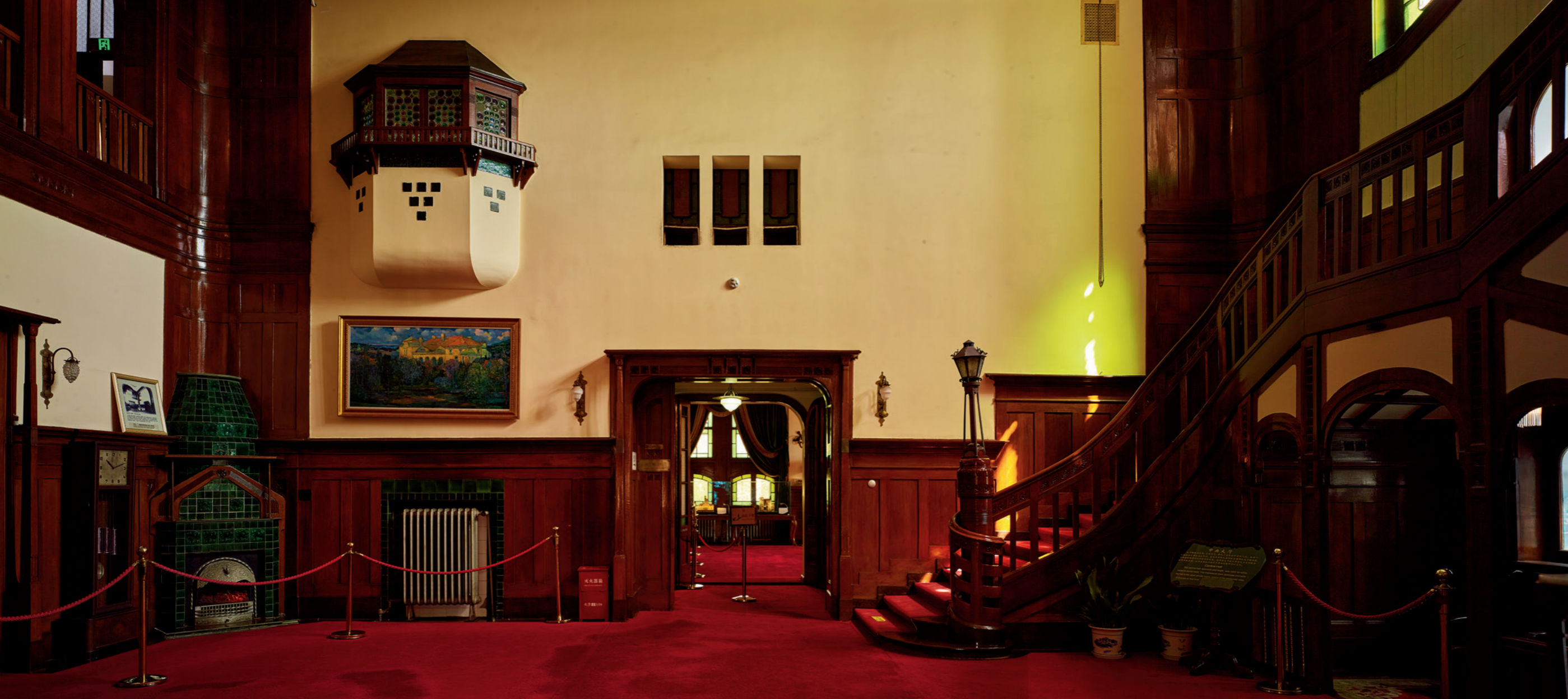
总督官邸内部，装饰丰富，壁炉上甚至镶有玉石，金属暖气片与今天的相比并没太大区别

确定青岛最初建筑风格的自然是德国人。德国强租青岛之后的城市规划，如同在一张白纸上作画，可以随心所欲完全按照自己的意愿行事。19 世纪末 20 世纪初，真正在青岛生活的德国人，不到青岛总人口的 5%。如果让这些入住进传统中式建筑里，不仅会大大抵消他们作为征服者的心理优势，更会增加他们“独在异乡为异客”的孤独感。据说，德国总督屈珀尔的想法很明确，就是通过一系列具有德国风情的建筑，来营造一个可以让德国人安心住在异乡的场景。