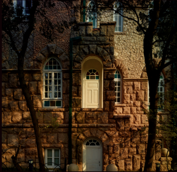
多元的设计风格与统一的整体风貌是青岛城市建筑的重要特征