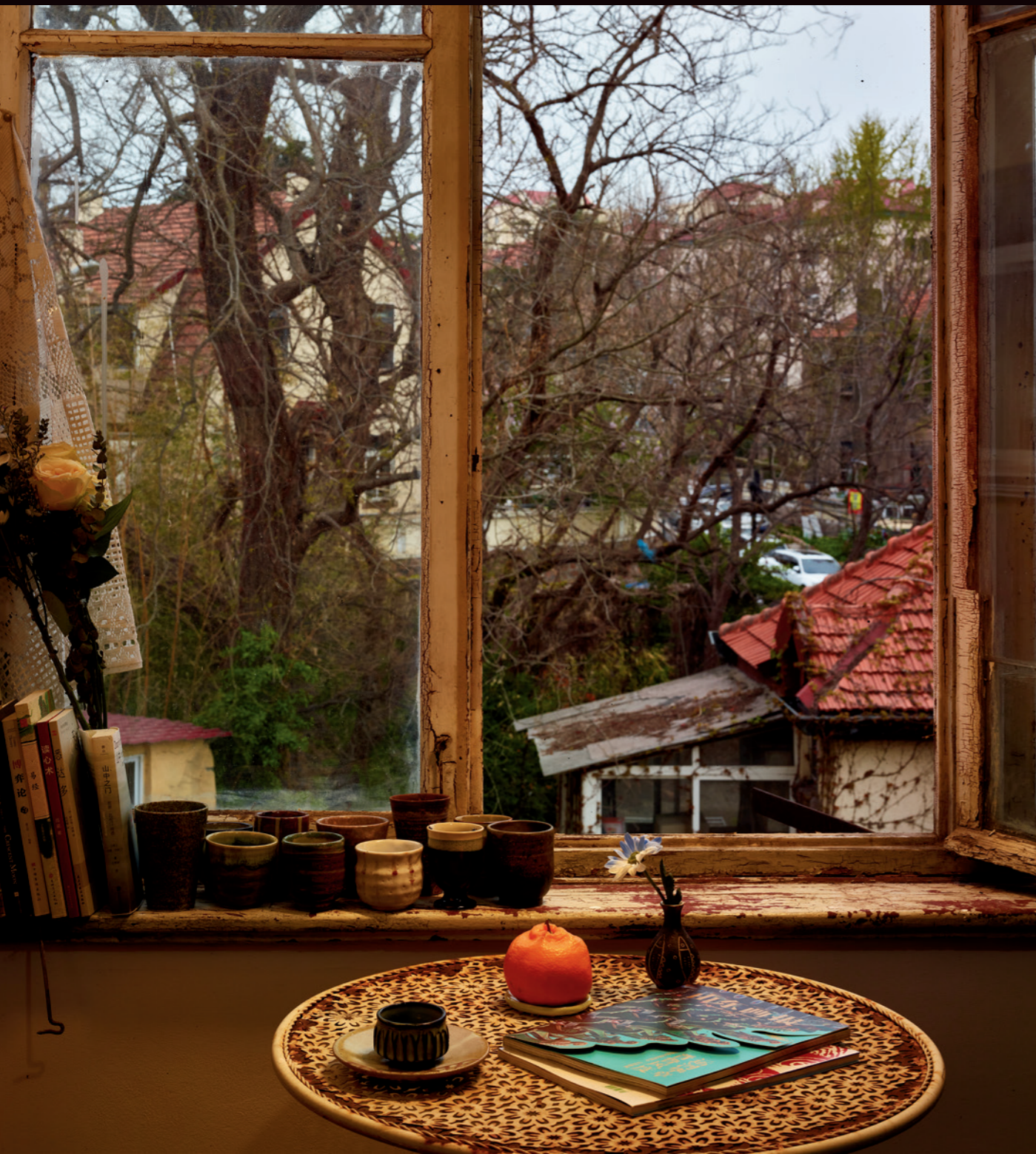
越来越多的年轻人住进老屋，沉浸于一本书一盏茶的日子