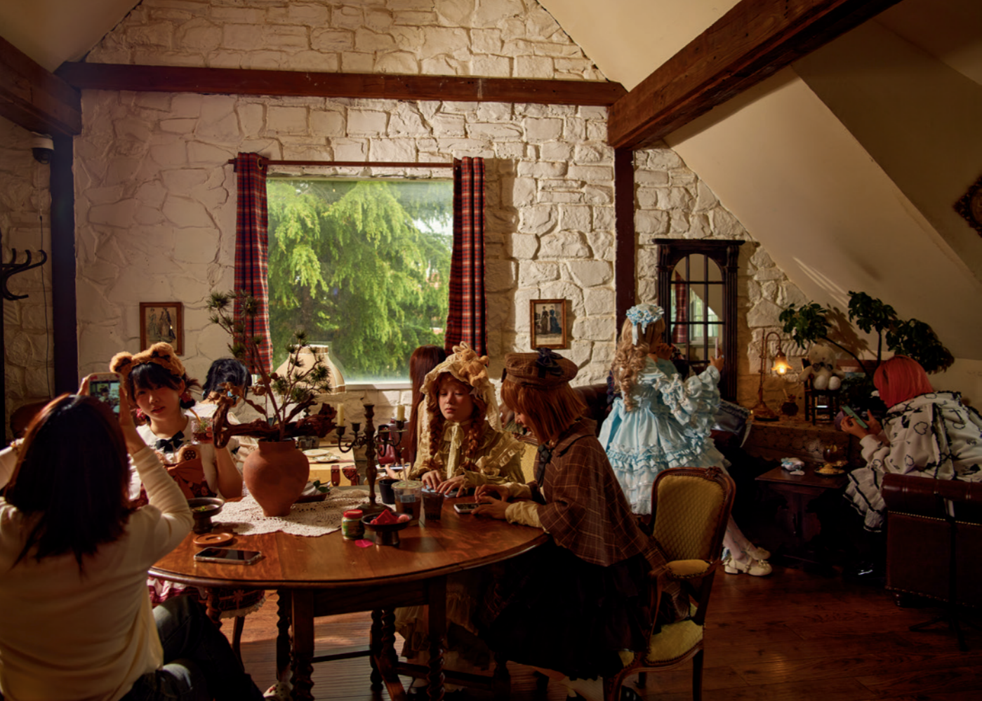
洛丽塔服饰爱好者的聚会

当我们长大后，总会记得第一次邂逅法国这个浪漫国度的时刻。不管是通过小说、诗歌，还是电影，法国总是绮丽多姿的。对于笔者来说，与法国相遇是通过大仲马的《基督山伯爵》。小说那跌宕起伏的情节，让正在读初中的我久久沉浸其中。书中对于法国的描写，比如气候多变的港口、地势起伏的岛屿、特有的人文风情，伴随着那个盛夏的记忆，深深镌刻在了我的脑海。 正因为法国与浪漫紧密相连，因此开一家独具特色的法式咖啡厅是一件很有挑战的事情，因为顾客首先要看看咖啡厅的格调是否浪漫。而位于湛山一路的五号老洋房「Mansarde」，绝对会让你惊呼「氛围感拉满」！独栋两层小洋楼，红屋顶、白色墙体，自带庭院与露台，营造出童话般的法式氛围，尤其是那标志性的红色斜尖顶，让它即使在建筑类型众多的太平角，也成为独具亮眼的存在。