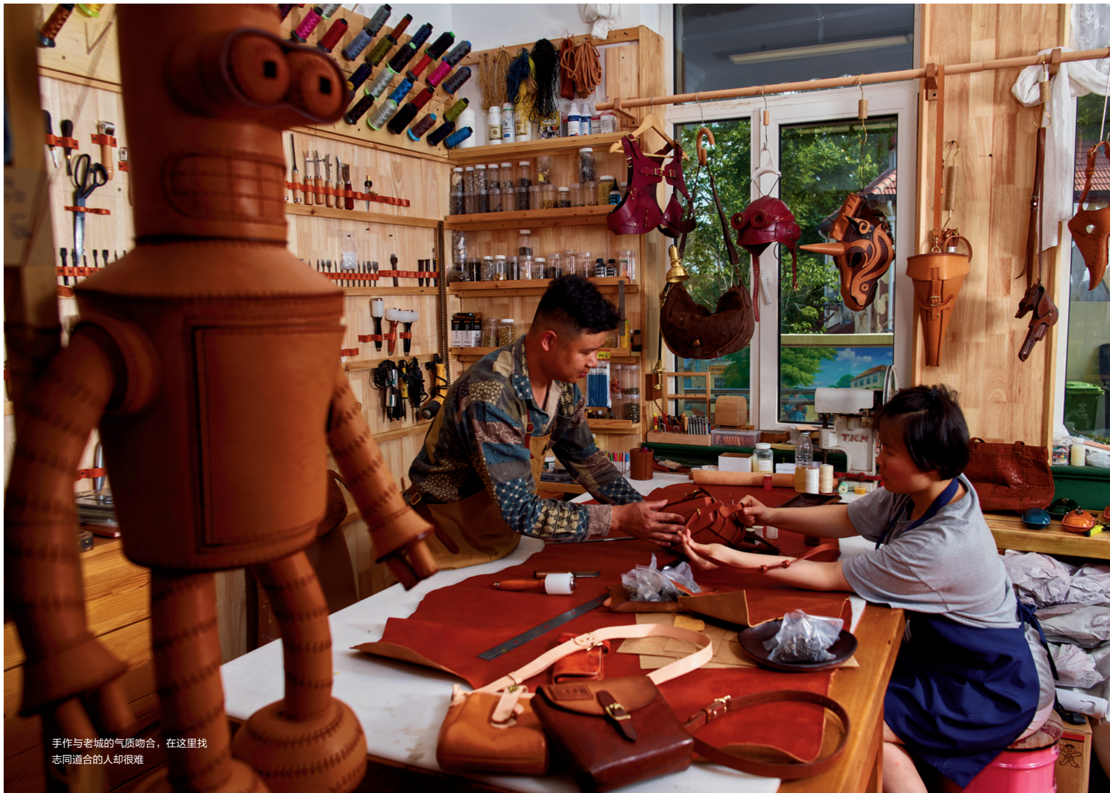
手作与老城的气质吻合，在这里找志同道合的人却很难