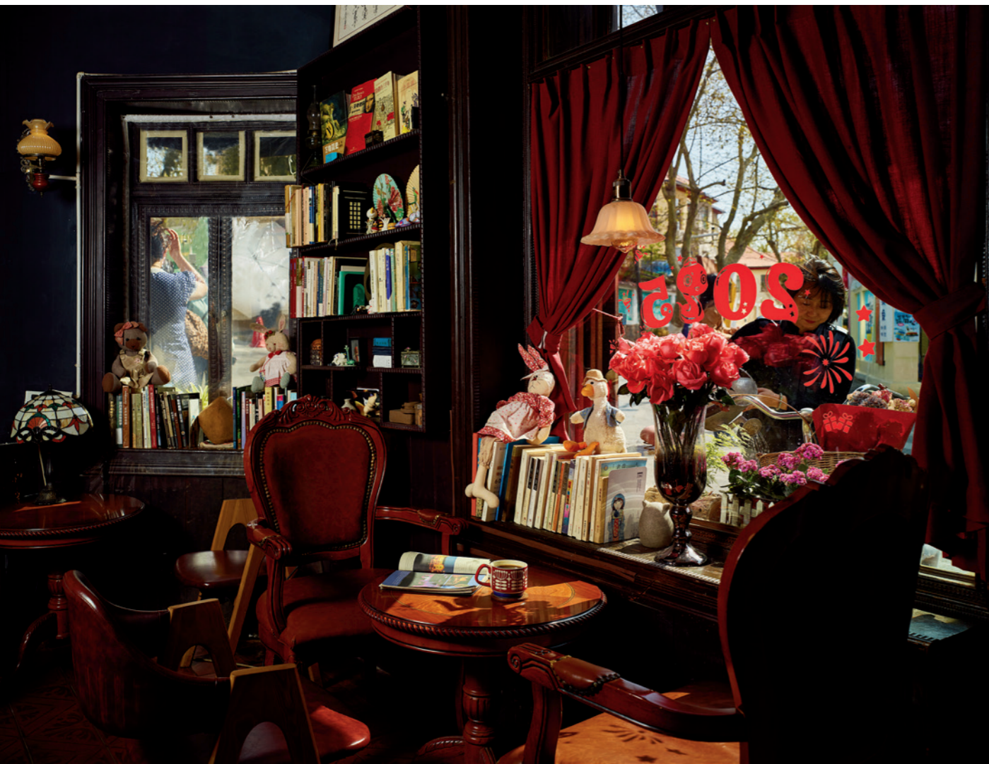
安静与喧闹，只是一扇窗的两面

「不舍昼夜」不仅是一个店名，更是一种生活态度——在快节奏的都市中守护着阅读与思考的慢时光。