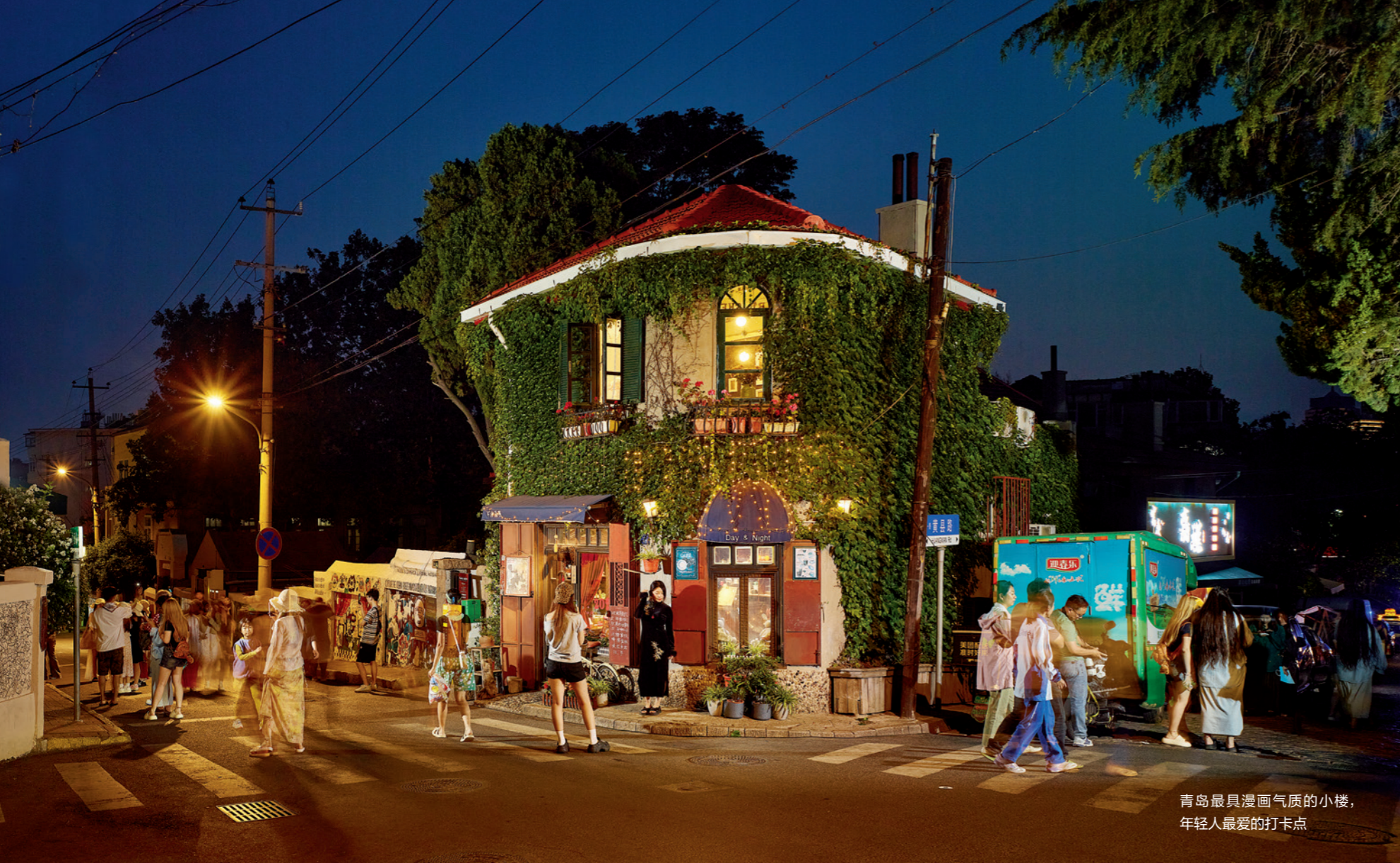
青岛最具漫画气质的小楼， 年轻人最爱的打卡点