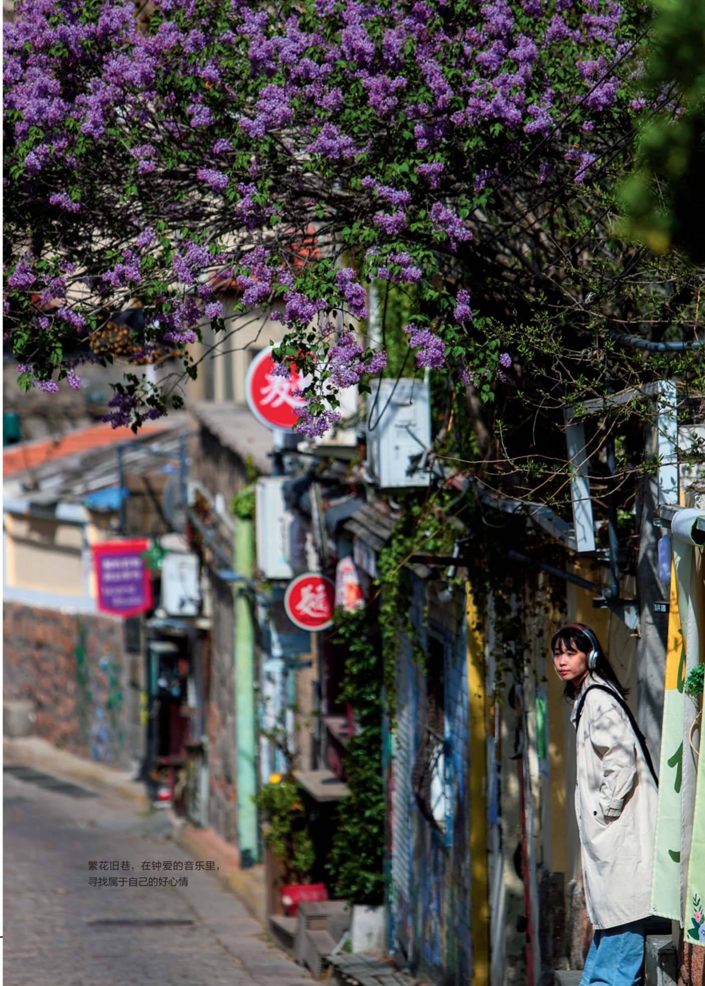
繁花旧巷，在钟爱的音乐里， 寻找属于自己的好心情