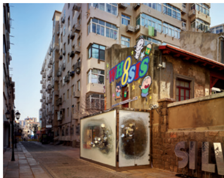
在每一个不显眼的街角，都可能有一片新天地

就这样，几个拐弯之后，我便走进了一个犹如结界般的赛博朋克世界。绚烂的灯光打在刻意保留「伤痕」的砖墙上，也打在青春洋溢的笑脸上；裸露的红砖墙与粗糙的水泥、冰冷的金属混搭，构建出独特的时尚质感；大幅的镜面将人映射进不断层叠的空间里；硕大的显示屏轮番播放着时尚广告，让街道忽明忽暗；时尚的年轻人品尝着手磨咖啡，舞着哈利波特的魔法棒，在多个里院间穿行，仿佛凭空一点就能幻化出一个新的空间。 银鱼巷的名字来源于德文 Silberfisch，直译过来便是「银鱼街」。于是，在改造过程中，山东味的「宁阳路」就变成了「上街里·银鱼巷」，既有了让年轻人认同的时尚感，又颇具青岛海滨特色。于是，不少来自全国各地的文艺青年，在青岛站下车之后的第一站，从栈桥变成了银鱼巷。不过，白天的银鱼巷安静得很，要想体验朋克世界的魅力，最好等到夜色浓郁之时。 银鱼巷追求极致的现代与时尚，四方路则把复古压缩进了每一处细节里。 到青岛四方路历史文化街区之前，我最喜欢连云港老街。位