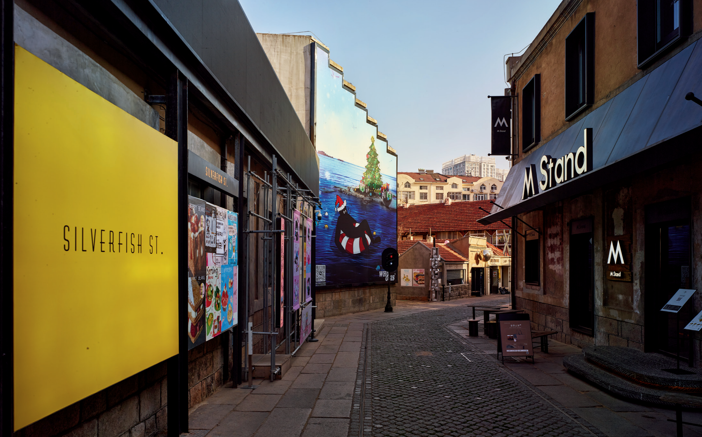
白天的银鱼巷与钟爱它的年轻人一起休憩，等待夜晚释放活力