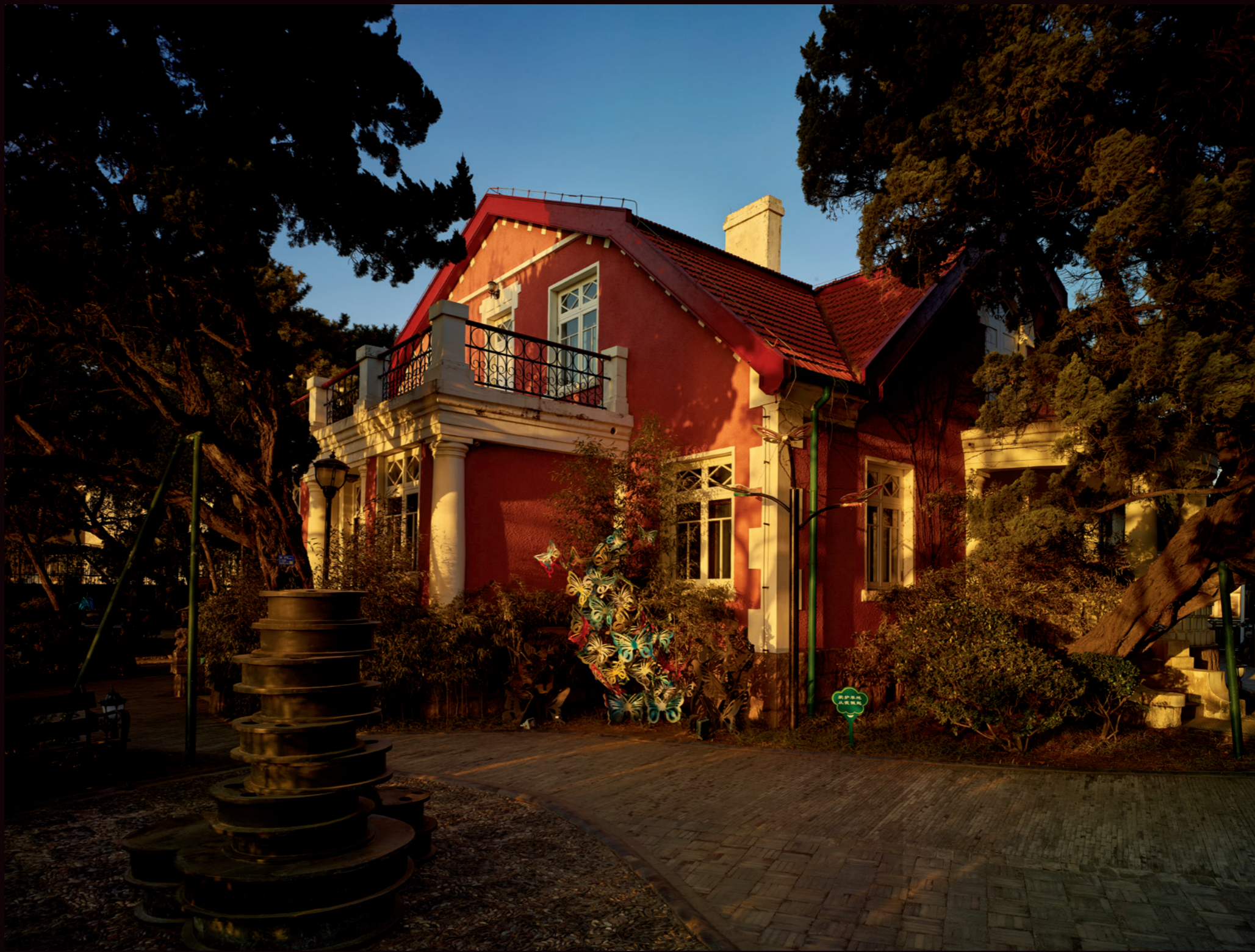
青岛湾的夕阳洒在蝴蝶楼上，温暖又浪漫，与百年前毫无二致

不过，青岛的红瓦着实还是有些特色的。早在明崇祯十年（1637）刊印的宋应星著《天工开物》一书中，就有中国烧制红瓦技术的记载。不过，红瓦当时的应用较少。青岛老建筑中的红瓦，也非中式传统制作的手工瓦，而是由德国人建厂生产的机制瓦，在当时也几乎只用于欧人建筑。1899年，根据胶澳总督府的要求，大鲍岛以北的区域建立了一座蒸汽砖瓦厂，后在黄岛又建成了第二座。显然，红瓦近乎是以一种文化渗透的方式，影响了之后青岛的建筑基因。相比于中国